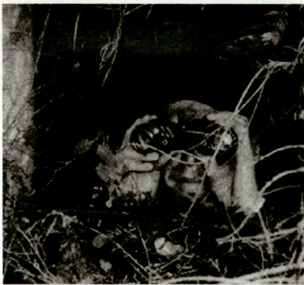
Aufklärer im Beobachtungsposten.

wie der Kdo / Uem Zfhr im Kommandobereich eingesetzt werden können.