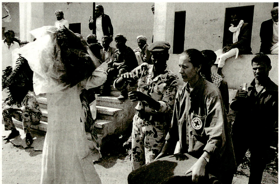
Hilfsgüterverteilung durch eine Delegierte des IKRK vor dem Zentralgefängnis in Saada, Jemen.