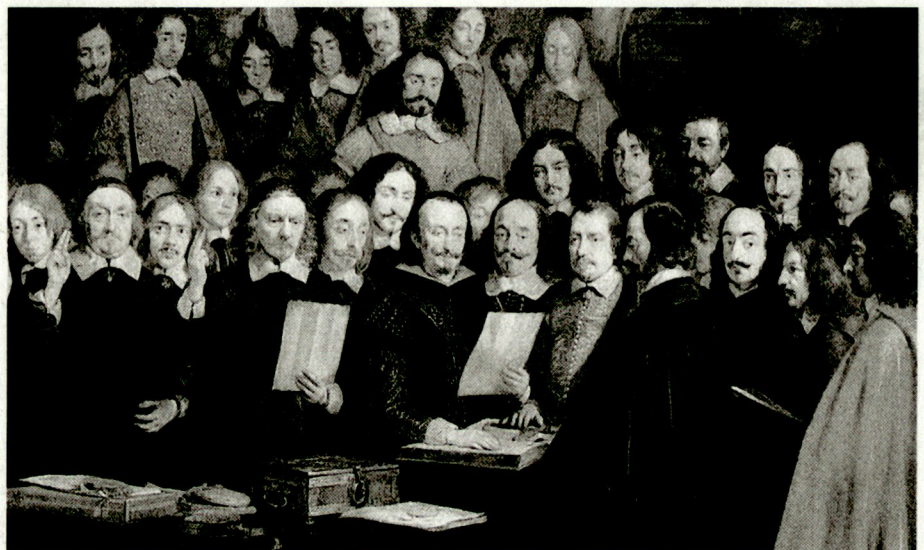
Gerhard Terborch, Beschwörung des Spanisch-Niederländischen Friedens 1648 (National Gallery, London).