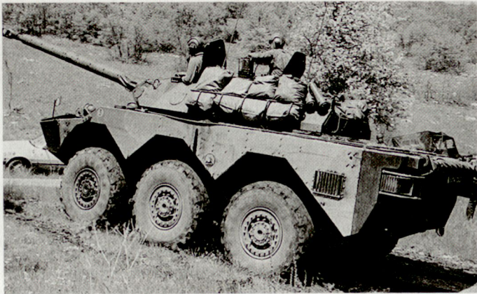
Einsatz von Schützenpanzern in Krisenregionen: AMX-10RC (Frankreich)

kontingente in den aktuellen Einsatzgebieten die folgenden Hauptaufgaben zu erfüllen: