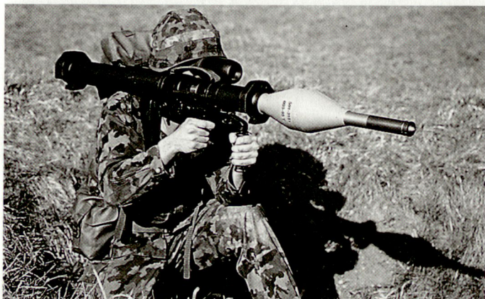
Hohlladungsgranate 95 für die Panzerfaust 3 aus der Produktion der SM.

Wie die Erfahrungen zeigen, haben terrestrische Truppen-