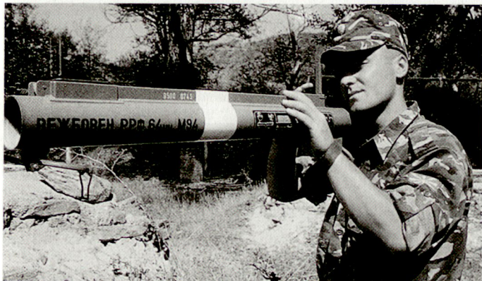
Die mazedonische Armee ist noch grösstenteils mit Material aus früherer jugoslawischer Produktion ausgerüstet.

land (aus Beständen der früheren NVA), rund 100 Kampfpanzer T-55 sowie Artilleriegeschütze aus Bulgarien sowie weiteres Material aus diversen westlichen NATO-Staaten. Mit dem schweren Material sollen die auf dem Papier vorhandenen drei Armeekorps ausgerüstet werden, wobei gemäss vorliegenden Planungen jedes Korps ein Panzerbataillon erhalten soll. Der Grossteil vorhandener Bewaffnung und Ausrüstung, insbesondere im Bereich der Infanterie- und Panzerabwehrwaffen, stammt aber weiterhin aus früherer jugoslawischer Produktion, wobei unterdessen auch versucht wird, gewisse leichte Waffen im eigenen Lande nachzubauen. Im Rahmen des NATO-Programms «PfP» fanden in den letzten Jahren mehrere multinationale Militärübungen in Mazedonien statt. Eine enge Beziehung zu ausländischen Streitkräften ergab sich zudem durch das UNPREDEP-Mandat, das zu Beginn dieses Jahres ausgelaufen ist. Grundsätzlich können die mazedonischen Streitkräfte mit ihrer vorhandenen Stärke und Ausstattung den Schutz der eigenen Grenzen kaum sicherstellen. Im Zusammenhang mit der Bewältigung der Krise im Kosovo sind sie auf ausländische Hilfe angewiesen, wobei ihnen die bisherigen Erfahrungen und Kooperationen mit der NATO zugute kommen. hg