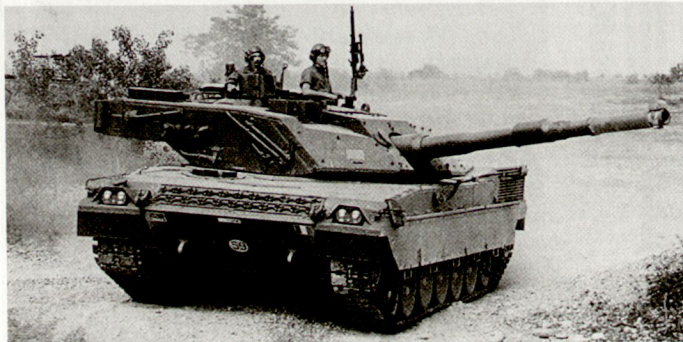
Pläne für eine Berufsarmee (Bild: italienischer Kampfpanzer «Ariete»).

Zwischenzeit von 28000 auf 22000 ab, währenddem man einen Bestand von 120000 Unteroffizieren anstrebt. Um Freiwillige zu gewinnen, wird der Sold erhöht und wird Hilfe bei der Berufssuche nach kürzeren Verpflichtungsperioden angeboten. Der Minister glaubt, dass die italienische Armee innert sechs Jahren voll professionalisiert werden kann, was jedoch zu einer Erhöhung des Verteidigungsbudgets führen wird. Bt