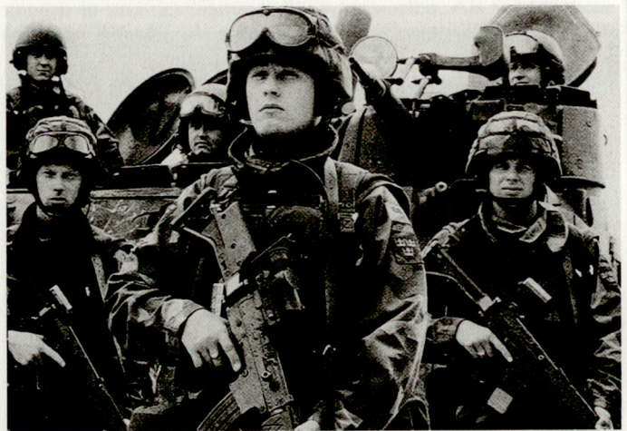
Schwierige finanzielle Situation bei den schwedischen Streitkräften.