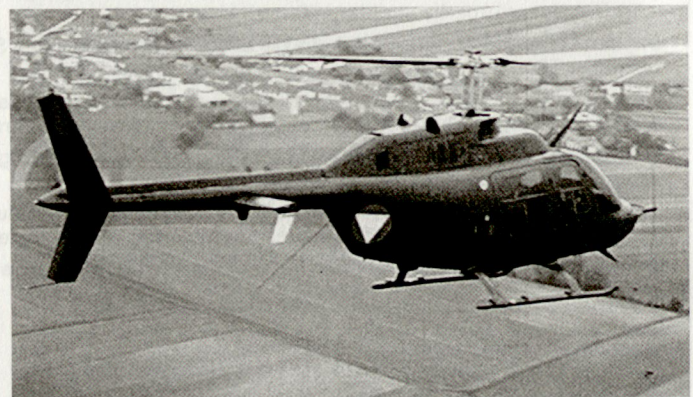
Leichter Helikopter AB-206 des österreichischen Bundesheeres.

ten ausländischen Rettungseinsätze. Während Tagen standen unter anderem Helikopter der US Army, der deutschen Bundeswehr sowie auch ein Super-Puma der Schweizer Armee im Einsatz. Im Anschluss an diese Hilfsflüge wurden in den österreichischen Medien in zunehmendem Masse die Mängel bezüglich Mittel und Ausrüstung des Bundesheeres hervorgehoben. Dabei wurden dem eigenen Verteidigungsministerium Versäumnisse bei den Rüstungsbeschaffungen respektive falsche Ausrüstungsplanungen vorgeworfen. Als vordringliche Beschaffungsbedürfnisse im Hin-