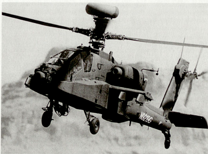
Erster Prototyp der britischen Version des «Apache».

Die seit Mitte der 80er Jahre gebauten Kampfhelikopter «Apache» wurden bisher auch nach Ägypten, Griechenland, Israel, den Niederlanden, Saudi-Arabien, an die Vereinigten Arabischen Emirate und neuerdings auch an Grossbritannien verkauft. hg