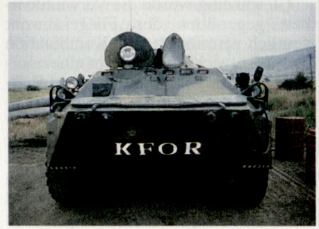
Am 12. Juni besetzten die Russen den Flugplatz von Pristina.