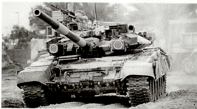
Neuste Version des russischen Kampfpanzers T-90.

inkl. Stealth-Typen sowie auch gegen ballistische Lenkwaffen) einsetzbar sein. Das System S-400 verfügt über die beiden Flugkörpertypen 9M96E und 9M96E2, die aus den mit vier Abschussrohren bestückten Abschussfahrzeugen eingesetzt werden können. Der weiter verbesserte Lenkwaffentyp des Systems S-400 hat gemäss Herstellerinformationen eine maximale Reichweite von 120 km und soll Luftziele bis in eine Höhe von 30 km bekämpfen können. Gemäss russischen Angaben sollen die ersten Lieferungen an die eigene Luftwaffe Russlands, in die unterdessen auch die früher selbständigen Luftverteidigungskräfte integriert worden sind, gegen Ende 1999 beginnen. Zudem erhofft sich natürlich die russische Rüstungsindustrie Verkaufsmöglichkeiten für dieses Abwehrsystem, das auf dem internationalen Waffenmarkt als grosser Konkurrent zur amerikanischen «Patriot» angesehen werden muss. hg