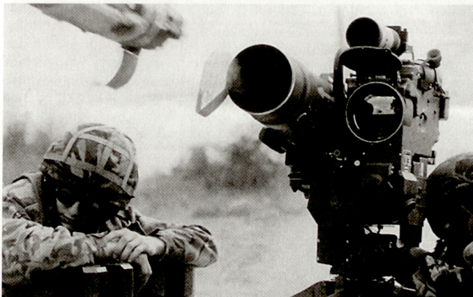
Grünes Licht für die Beschaffung der PAL «Trigat» (PARS-3-MR) für die britische Armee.

Grossbritannien will vorerst die neuen Scharfschützengewehre vom Typ L96 den Schnellen Eingreiftruppen zukommen lassen. Vorgesehen ist die Verwendung eines Gewehres mit dem leistungsstarken Kaliber .338 Lapua Magnum, das eine maximale Reichweite von über 1000 m ermöglichen soll. Die verwendete Version ist mit einem Zielfernrohr 6x42 versehen, allerdings können jederzeit andere Optiken oder auch Nachtsichtgeräte angebracht werden. Das Scharfschützengewehr L96 besitzt einen längs geteilten Kunststoffschäft mit integriertem Zweibein. Zur Verminderung des Aufsteigens der Waffe bei der Schussabgabe ist eine asymmetrische Mündungsbremse vorhanden. hg