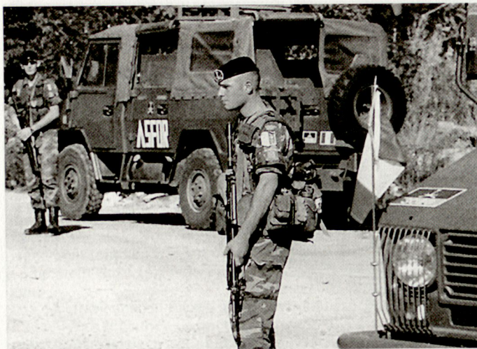
Mit neuen Dienstleistungsmodellen soll auch in der italienischen Armee die Personallage verbessert werden.

Deutschland wird zudem an internationaler sicherheitspolitischer Glaubwürdigkeit und Verlässlichkeit einbüßen. Zur Erreichung des Zieles, eine eigenständige EU-Aussen- und Sicherheitspolitik mit militärstrategischer Unabhängigkeit von den USA zu schaffen, könnte Deutschland mit den vorgesehenen Kürzungen keinen wesentlichen Beitrag mehr leisten. Tp