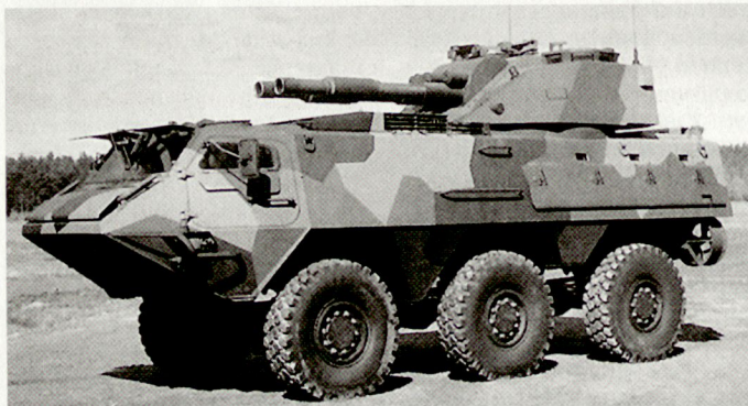
Mobiler Zwillingminenwerfer XA-185 AMOS, eine Entwicklung der finnischen Rüstungsindustrie.

Die Rüstungsindustrie hat mit ihrem Überlebenspro-