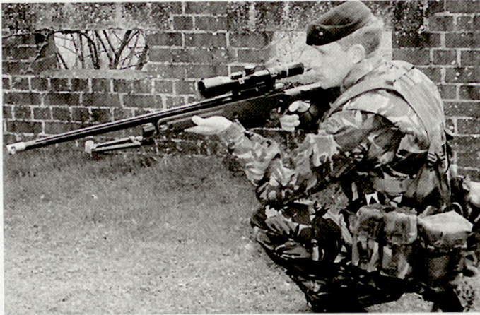
Scharfschützengewehre für Angehörige der britischen Schnellen Eingreiftruppen.