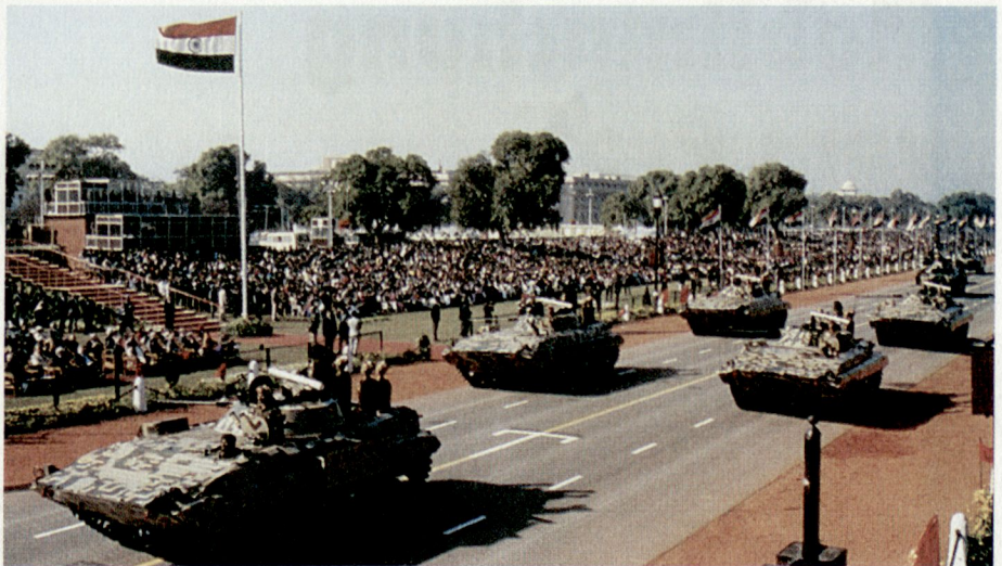
Die mechanisierte Infanterie erweist dem Oberbefehlshaber der Armee, Präsidenten von Indien, die Ehre.

In den letzten Jahren seien die bilateralen Kontakte auf politischer, kultureller und wirtschaftlicher Ebene vor-