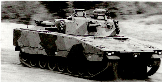
Kampfschützenpanzer CV-9030 der norwegischen Armee.

stärkt werden. Diese Kampfgruppe im Umfang von 1400 Mann soll bei Bedarf jederzeit durch weitere 700 Soldaten verstärkt werden können.