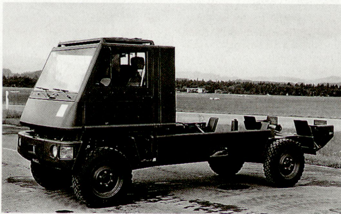
Grundversion des Geländefahrzeugs «Duro».

Streitkräfte vorgestellt und vorgeführt. Der Zweck dieser Vorführungen, nämlich die ausgezeichneten Fahreigenschaften und die Universalität des allradangetriebenen «Duro» für den zivilen und militärischen Einsatz einer anspruchsvollen Kundschaft vorzustellen, wurde dabei erfüllt. Mit dem Resultat einer ersten Bestellung durch die schwedische Firma Berco. Dabei handelt es sich um den ersten Auftrag für Schweden, wobei gemäss Aussagen eines Firmenvertreters von Bucher-Guyer gute Möglichkeiten für weitere Aufträge im schwedischen Markt bestehen. hg