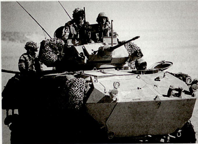
Schützenpanzer LAV-25 des US-Marinekorps.

Die langjährige Zusammenarbeit von DDGM und Mowag begann mit dem Abschluss des ersten Lizenzvertrages im August 1976. Sie wurde 1977 verstärkt, als die kanadische Armee den Mowag Piranha 6x6-Radpanzer gegen internationale Konkurrenz auswählte. Die kanadische Regierung bestimmte für diesen Auftrag DDGM als Hersteller und Lieferant der Fahrzeuge. Nach dem Erfolg in Kanada gewann DDGM mit der 8x8-Version des Piranha