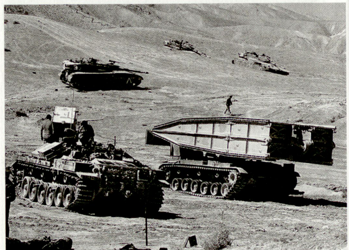
Die Umstrukturierung bei der israelischen Armee betrifft vor allem auch die Panzertruppe.

Nach der laufenden Umstrukturierung wird der Operationsabteilung künftig mehr Kompetenz übertragen. Die Verbände sollen für die neuen Herausforderungen, d.h. für hochbewegliche Land- und Luftoperationen, ausgerüstet und ausgebildet werden. Dabei sollen u.a. den Panzerverbänden moderne Unterstützungsmittel (Kampfheli, Drohnen, mobile Führungselemente usw.) zugeteilt werden. hg