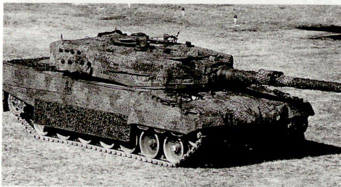
Schwedischer Kampfpanzer «Leopard 2S».

In einem zweiten Auftrag werden die älteren Versionen der Kampfschützenpanzer CV-9040A soweit kampfwertgesteigert, dass sie auch während der Fahrt zielen und schießen können. hg