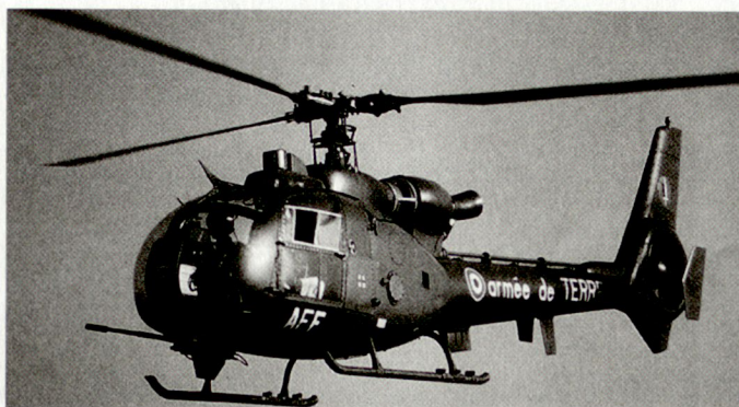
Helikopter «Gazelle» der französischen Armée de Terre.

Die Heeresfliegerkräfte werden künftig – neben der Helikopterschule, die auf drei Stütz-