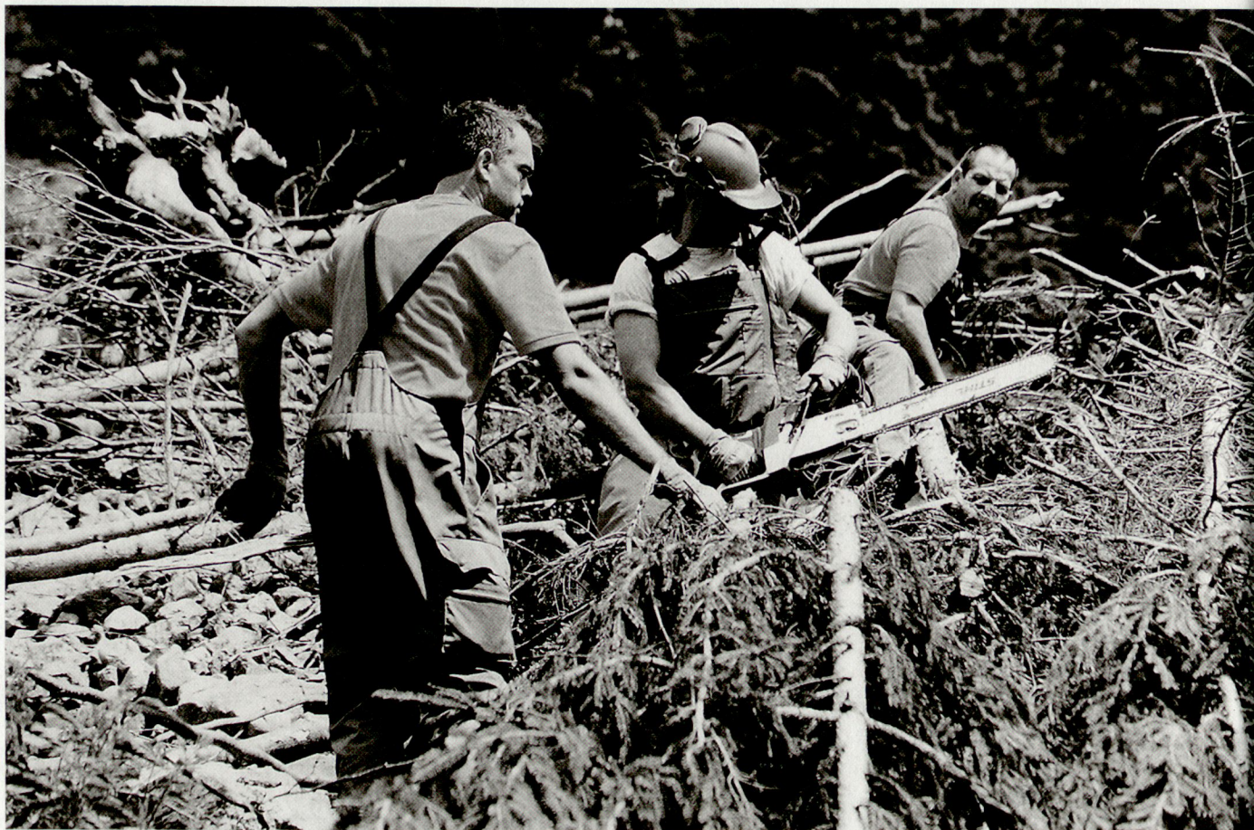
Eine zeitgemässe und praxisbezogene Ausbildung und eine katastrophentaugliche Ausrüstung erlauben einen bedürfnisgerechten und effizienten Einsatz des Zivilschutzes.

me des erweiterten Eidgenössischen Zivilschutz-Ausbildungszentrums Schwarzenburg (EAZ) – und der damit verbundenen Aufstockung des Instruktionspersonals – sind zwei entscheidende Voraussetzungen für eine zeitgemässe und praxisorientierte Ausbildung des Zivilschutzes geschaffen worden. Tatsache ist, dass eine professionellere Ausbildung die Leistungsfähigkeit der Zivilschutzorganisationen der Gemeinden erhöht, zur besseren Motivation der Schutzdienstpflichtigen führt und das Vertrauen der Bevölkerung in die vom Zivilschutz getroffenen Vorkehrungen stärkt.