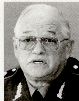
Marschall Igor Sergejew, Verteidigungsminister der Russischen Föderation.

Eine der Schlüsselrichtungen unserer Aussenpolitik ist die Bildung eines Sicherheitssystems auf dem ganzen europäischen Kontinent, in welchem die Organisation für Sicherheit und