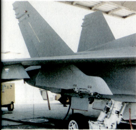
Noch bessere Flugleistungen dank aerodynamischer Waffenaufhängung Links: Swiss Low Drag Pylon. Rechts: US Navy Standard Pylon.