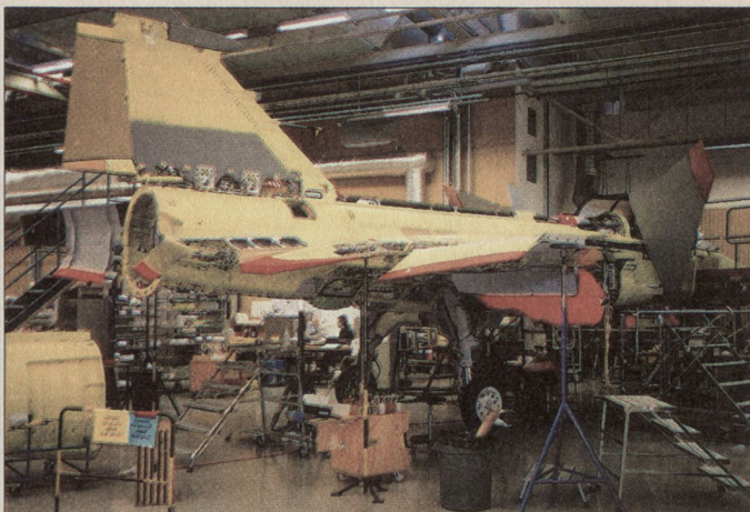
Montagehalle in Linköping, Schweden.

Die «Information superiority» bedeutet, dass sämtliche benötigten Informationen ins Cockpit und aus dem Cockpit übermittelt werden können. Diese Informationen erscheinen auf dem Mehrzweckdisplay