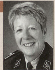
Doris Portmann, Brigadier.

Wenn nun aber fest steht, dass in der Schweiz nicht genügend Einsatzmöglichkeiten für alle Pflichtigen vorhanden sind, kommt für mich die Einführung einer allgemeinen Dienstpflicht nicht in Frage. Es geht doch nicht an, dass wir eine riesige und immens teure Organisation auf die Beine stellen, nur um einer neu einzuführenden «Dienstgerechtigkeit» nachzuleben.