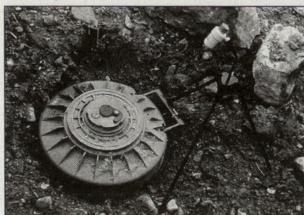
Panzerabwehrmine TMRP6 mit SM-EOD20-System.

Bosnien und für die KFOR im Kosovo ausgeliefert worden. Belgien, Finnland, Österreich und Luxemburg haben auch SM-EOD-Produkte eingesetzt. In anderen EU-Ländern stehen Evaluationen vor dem Abschluss. Auch die Schweizer Armee hat den Nutzen der Produktpalette für die humanitäre Minenbeseitigung erkannt und entsprechende Beschaffungen vorgenommen. Insgesamt stehen vier SM-Produkte zur Minenbeseitigung zur Auswahl. Neben der SM-EOD20 zur Vernichtung von Personenminen und Blindgängern produziert die SM die SM-EOD33 zur Vernichtung von vergrabenen und unter Wasser eingesetzten Minen und Blindgängern, die SM-EOD67 zur Vernichtung von Minen mit elektronischen Sperren und die SM-EOD190 zur Zerstörung von Bomben, die in einer Tiefe bis zu 4,5 Metern vergraben sind. (dk)