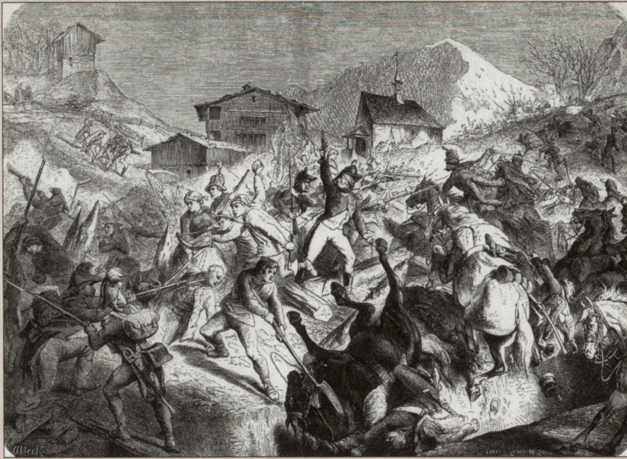
Der Kampf der Unterwaldner am Allweg am 9. September 1799 – weitgehendes Fehlen des Kompetenztransfers aus den Fremden Diensten.