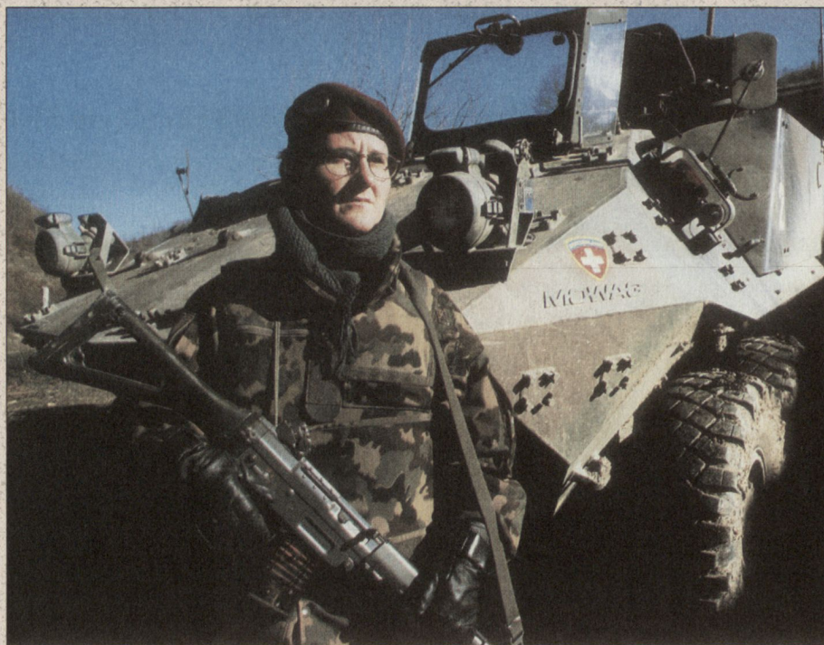
Die Fähigkeit des einzelnen Soldaten zum Selbstschutz ist auch bei Friedensoperationen zwingend. Im Bild ein Swisscoy-Soldat bei Suva Reka, Kosovo.

Die Notwendigkeit der Bewaffnung ergibt sich aus den drei grundsätzlichen Ein-