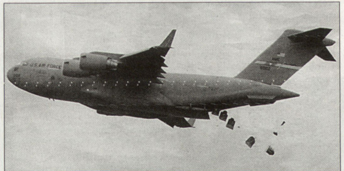
Transportflugzeuge C-17 der US-Air-Force sollen auch für Abwurf logistischer Güter genutzt werden.

Gegenwärtig wird die Modernisierung der C-5 studiert, um diese Maschinen weitere 30 bis 40 Jahre im Einsatz zu behalten. Noch ist unklar, wie viele dieser Maschinen diesem Kawest-Programm unterzogen werden sollen. hg