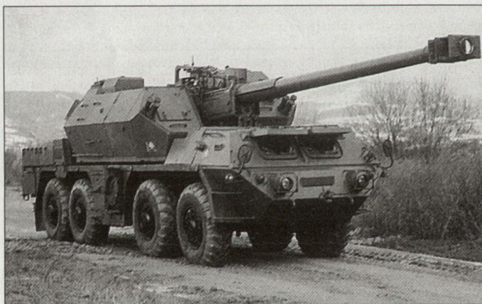
Selbstfahrkanone «Zuzana» aus slowakischer Produktion.

Bereits gegen Ende dieses Jahres soll der Typenentscheid gefällt werden. hg