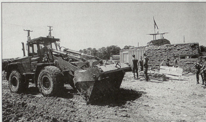
Zivil-militärische Zusammenarbeit im Kosovo.

Wichtige Träger der G5/CIMIC-Arbeit sind aber nicht nur