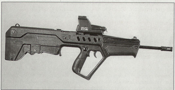
Grundversion des neuen israelischen Sturmgewehrs «Tavor» (TAR-21).

Von besonderem Interesse ist das Scharfschützengewehr, das über eine spezielle Ausstattung (Teleconverter, Laserpointer usw.) verfügt. Unter der Bezeichnung «SAAR» steht auch die Version eines leichten Maschinengewehrs im Sortiment, das wesentlich handlicher und auch leichter als die Vorgängerversionen ist. Diese Waffe ist standardmässig mit einem Trommelmagazin von 200 Schuss Inhalt ausgerüstet. D.E.