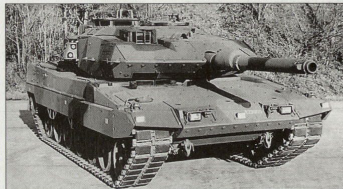
Lizenzproduktion des Kampfpanzers Leopard 2A5 in Spanien.

Der Auftrag umfasst die Lieferung von Combat-Systemen für den Kampfpanzer Leopard 2 – jeweils bestehend aus Feuerleitanlage, Rundblick-Periskop, Panzerprüfergerät und Führungssystem – sowie 16 Führungssysteme für Bergepanzer. Der Auftrag ist Teil eines Beschaffungsprogramms für das spanische Heer.