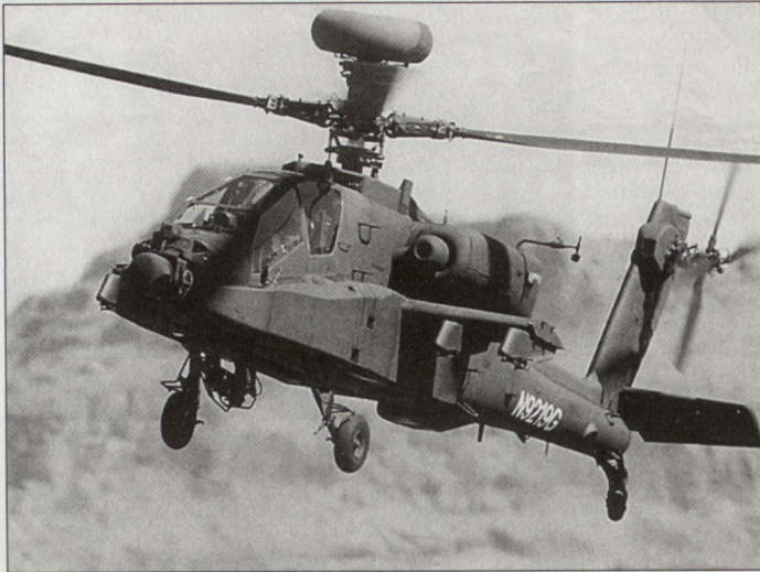
Kampfhelikopter AH-64C «Apache», ausgerüstet mit Radarsystem «Longbow».

Tranche wird gemäss Planungen in den nächsten zwei Jahren durchgeführt. Gleichzeitig sollen für die Bewaffnung der Kampfhelikopter weitere lasergelenkte Lenkwaffen vom Typ AGM-114