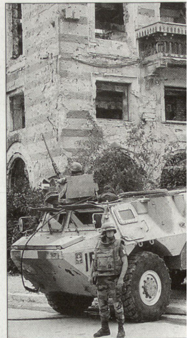
Mit dem Aufbau eines eigenen Einsatzkorps wollen die Europäer mehr Eigenständigkeit bei friedensunterstützenden Operationen erreichen. (Bild: französische Truppen der SFOR in Sarajewo.) ■

treter mancher Staaten, wie etwa der französische Verteidigungsminister A. Richard, an das künftige Einsatzkorps ambitionöse Erwartungen wie die Befriedung von Konflikten vom Typus Kosovo richten, besteht unter Politikern und Experten weitgehend Einigkeit, dass das EU-Eingreifkorps ohne Sukkurs von aussen in absehbarer Zukunft auf dem Gebiet des Krisenmanagements nur bescheidene Aufgaben im Hinblick auf die militärische Krisenbewältigung selbstständig übernehmen kann. hg