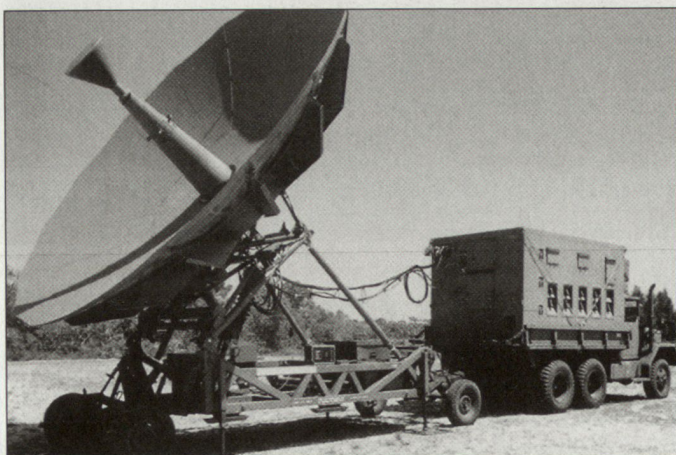
Mobiler Terminal SATCOM der US Army.

Für die Führungsstrukturen der KFOR konnten wichtige Erfahrungen, die während der nun bereits vier Jahre dauernden IFOR/SFOR-Einsätze gemacht worden sind, berücksichtigt werden. Dabei hat sich gezeigt, dass die Verwendung der Infrastruktur kommerzieller Informations- und Übermittlungssysteme zunehmend erforderlich wird. Allerdings müssen jederzeit zusätzliche militärisch kontrollierte Reserve-systeme vorhanden sein. Ein zentraler Punkt ist auch die Sprachausbildung für die in der Führung und Übermittlung tätigen Offiziere und Soldaten. hg