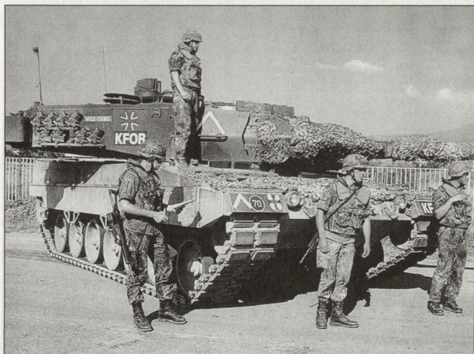
Die Bundeswehr soll noch vermehrt auf Kriseneinsätze vorbereitet werden. (Bild: Kampfpanzer «Leopard 2A5» im Kosovo)

bewältigung sowie Bündnisverteidigung an den Flanken der NATO in den Vordergrund. Das bedeute eine Umkehr der bisherigen Prioritäten: Krisenreaktion, Bündnisverteidigung an den Flanken, Landesverteidigung an den Landesgrenzen. Hierdurch sei eine völlige Umstrukturierung der Bundeswehr erforderlich. Derzeit könnten aber nicht die dazu erforderlichen Finanzmittel zur Verfügung gestellt werden. Ohne Geld keine neue Struktur, betonte der General. Eine solche Umstrukturierung sei aber erforderlich, um die Verpflichtungen der Bundesregierung gegenüber der NATO, der Europäischen Union und der WEU zu erfüllen. Hier gibt es zweifelsohne einen Widerspruch. Der Generalinspekteur wies darauf hin, welche negativen Auswirkungen die Unsicherheit über die weitere Entwicklung der Verteidigungsausgaben auf die Streitkräfte habe. Die Balkanoperationen zeigten das Grundmuster der Aufgaben, denen sich die Bundeswehr in der Zukunft zu stellen habe. Bundeskanzler Gerhard Schröder, der nach dem Generalinspekteur sprach, stellte ebenfalls die Not-