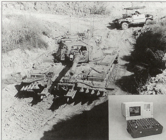
Israelisches Fernbedienungssystem für Kampf Fahrzeuge vom Typ Pele-2000.

seitigung von Minen und Kampfmitteln oder die Durchführung besonders gefährlicher Missionen. Das System Pele-2000 ist modular aufgebaut und kann gemäss Herstellerangaben nachträglich in relativ kurzer Zeit in jedes Gefechtsfahrzeug (in Kampf- und Schützenpanzer) eingebaut werden. Entwickelt und produziert wird Pele-2000 durch die israelische Firmengruppe «Israel Aircraft Industries Ramta Division». Beim