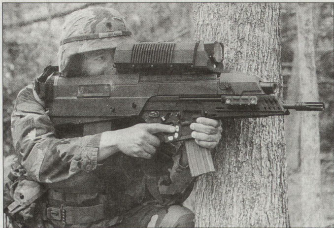
Projekt einer neuen Infanteriewaffenfamilie für die US Army.

Zielgerät gemessene Entfernung zum Ziel wird innert Kürze in den Zünder programmiert, sodass die Granate genau im Ziel detoniert. Mit dem Computer im Zielgerät lassen sich zudem verschiedene Detonationsarten vorprogrammieren (Explosion vor oder hinter dem Ziel, beim Aufschlag oder mit Verzögerung). Das digitalisierte Ziel- und Feuerkontrollgerät soll