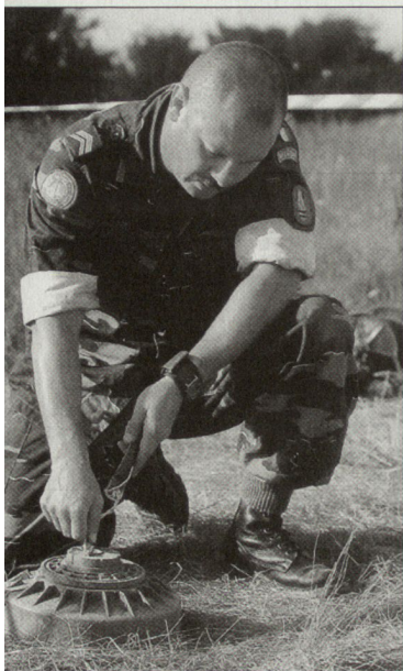
Belgischer Soldat bei der Minenaushebung im Kosovo.

bietet noch Platz für zwei Soldaten sowie für die Komponenten der Feuerleitanlage und die benötigten Richtgeräte. Das Gewicht des Waffensystems dürfte bei etwa 42 t liegen. Der Werfer TOS-1 dient der unmittelbaren Feuerunterstützung von vermutlich gepanzerten Truppen und wird auch zur wirkungsvollen Bekämpfung von Infanteriestellungen und Feldbefestigungen sowie von Bunkern eingesetzt. Zudem dürfte ein Einsatz im Ortskampf möglich sein. Gemäss ersten Hinweisen soll dieses Waffensystem auch bei den Kampfhandlungen in Tschetschenien zum Einsatz gelangt sein. Gemäss russischen Angaben wurde das mobile Werfersystem auf Grund militärischer Erfahrungen entwickelt, die im Verlaufe vergangener Kriege gemacht worden sind. Hersteller des Werfers TOS-1 ist das Konstruktionsbüro für Transportmaschinenbau in Omsk. Zum Werfersystem gehört auch ein Munitionstransportfahrzeug, das auf einem geländegängigen Radfahrzeug basiert. Seit etwa fünf Jahren wird der Raketenerwerfer TOS-1 auch zum Verkauf angeboten. hg