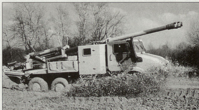
Leichtes mobiles Artilleriesystem «Caesar» vom Kaliber 155/52 mm.

Als kurzfristige Neubeschaffung ist der Kauf von mobilen leichten Selbstfahrkanonen vorgesehen. Diese von der französischen Rüstungsindustrie entwickelten Systeme vom Typ «Caesar» (Camion Equipé d'un Systeme d'Artillerie) sind auf einem Gelände-fahrzeug vom Typ «Unimog» auf-