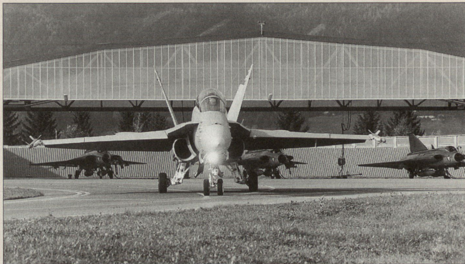
Schweizer F/A-18 zu Gast in Österreich.

Die Anlage der Übung mit den gewählten Führungsebenen, das Szenario und die zeitlichen Abläufe haben sich weitgehend bewährt. Für Friedenszeiten und für Katastropheneinsätze (z.B. Hochwasser in Vorarlberg) wurde ein grosser Nutzen des