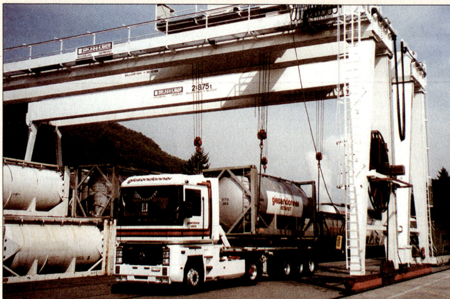
Im betriebseigenen Terminal der Giezendanner AG werden Container vom Bahn-waggon auf den LKW umgeladen.

Bei der Vergabe von grösseren Aufträgen geben im Transport- und Logistikbereich die Qualität und der Preis den Ausschlag