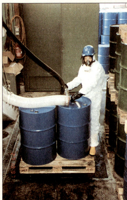
Zur Flüssigkeitslogistik gehört auch die Fassabfüllstation.

Gerne denke ich zurück an die Zeit der Fuhrhaltereie meines Vaters. Der Patron disponierte die Lastwagen, meine Mutter führte die Buchhaltung. Z. B. Heizöl oder Benzintransporte waren nicht weniger gefährlich als heute, nur wusste man weniger vom grossen Gefahrenpotenzial dieser Produkte. Der Chauffeur eines Kippers fuhr