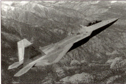
F-22, Raptor der USAF, erstes operationelles Jagdflugzeug der 4. Generation.

Der neue Quantensprung, welcher die Bezeichnung einer neuen (der vierten) Generation rechtfertigt, ist die Stealth-Bauweise. Darunter versteht man eine Flugzeugkonstruktion welche die Form und die Beschichtung des Flugzeuges derart ausgestaltet, dass ein sehr kleiner Radarquerschnitt resultiert. Daraus ergibt sich eine geringere Entdeckungswahrscheinlichkeit und dadurch eine grössere Überlebensfähigkeit.