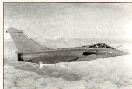
Jet-Jagdflugzeug Rafale M1 der französischen Marine der 3. Generation.

Ab etwa 1975 kam wieder eine neue Generation von Jet-Jagdflugzeugen in den Einsatz. Auch hier war der Quantensprung zweifach: