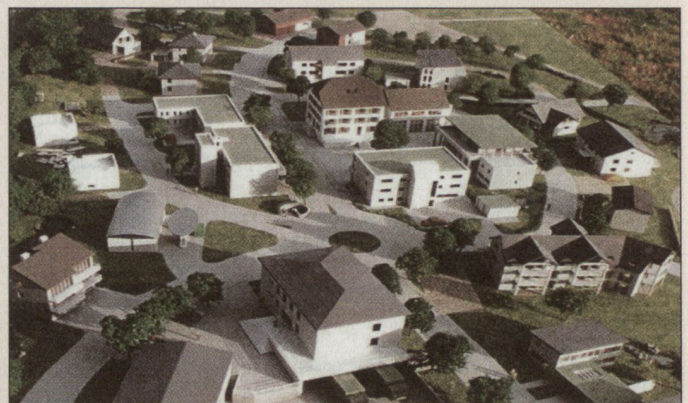
Die neue Ortskampfanlage Aeuli in Walenstadt für die KIUG- (Kampf im überbauten Gelände) Ausbildung.