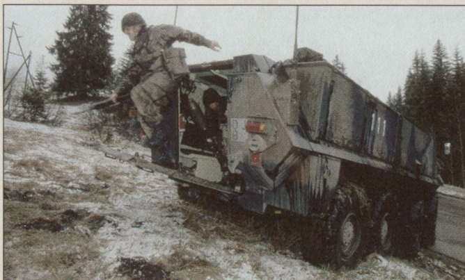
Infanteristen verlassen ihren Radschützenpanzer.

Das Infanterie-Ausbildungszentrum Walenstadt/St. Luzisteig (IAZ) wird in der Armee XXI nach heutiger Planung im Stab des Ausbildungschefs des Heeres (ACHE) als Infanterie-Ausbildungs- und Doktrinzentrum (IADZ) die Doktrininstelle für die beiden Infanterie-Lehrverbände sein. Neben der Erarbeitung von doktrinären Vorgaben bis Stufe Task Force wird das IADZ wie bis anhin die technischen Lehrgänge (TLG) für Bataillons- und Kompaniekommandanten sowie Grund-, Fach- und Weiterbildungskurse für Berufsoffiziere, -unteroffiziere und Milizoffiziere durchführen. Die Ausbildung zum Einheitskommandanten erfolgt neben dem TLG neu in einem zentralen Führungslhrgang am Armee-Ausbildungszentrum Luzern und anschliessend in einem zweiten Teil in den Lehrverbänden. Daneben ist das IADZ verantwortlich für die Einfüh-