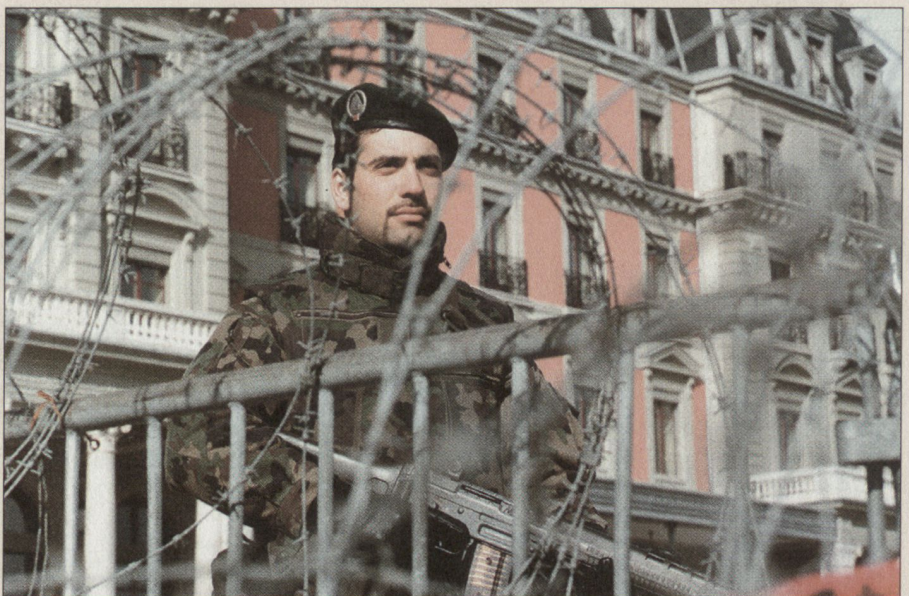
Der «Miles Protector».