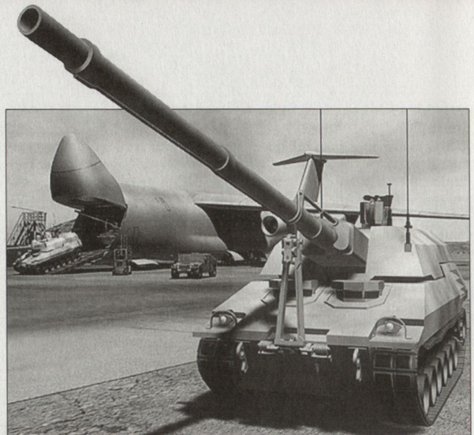
Nach anfänglichem Widerstand dürfte die Streichung des «Crusader»-Programms Tatsache werden.

Die autonom vorgehenden taktischen Kampfgruppen konnten bisher nur beschränkte Erfolge vorweisen. Unter dem feststellbaren energischen Vorgehen russischer Spezialkräfte leidet weiterhin vor allem die einheimische Zivilbevölkerung. Daraus entsteht ein weiter zunehmender Hass gegenüber russischen Soldaten sowie eine generelle antirussische Stimmung in der Region. Den tschetschenischen Rebellen wird dadurch die Rekrutierung von Kämpfern erleichtert. hg