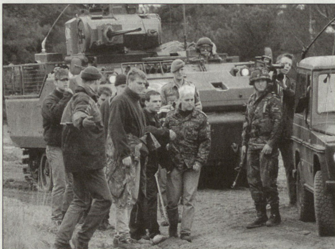
Niederländische Truppen in Mazedonien.

und der OSZE gewährleisten. Gemäss Beschluss des niederländischen Parlaments, der bereits im April dieses Jahres gefällt worden ist, soll diese Führungsfunktion für eine Periode von vier bis maximum sechs Monate eingenommen werden. Die Mission «Fox» ist vorderhand bis Ende 2002 bewilligt. Eigentlich war vorgesehen, dass die EU Ende Oktober dieses Kommando übernehmen sollte (siehe auch Beitrag: Konflikt zwischen Türkei und Griechenland verhindert EU-Truppeneinsatz). hg