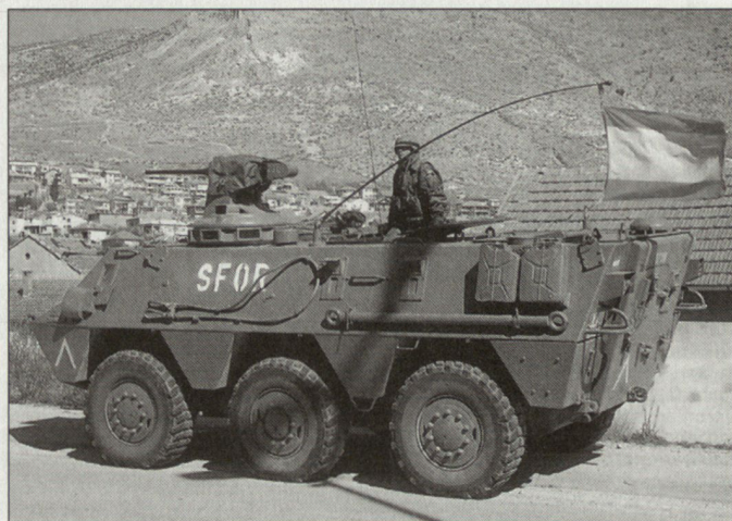
Spanische Truppen bei der SFOR (Bild: Spz BMR-600).