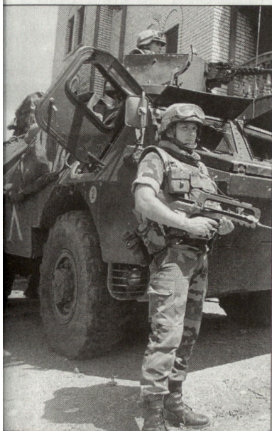
Französische Truppen der KFOR mit Schützenpanzer VAB.

Parallel zu den Planungsgrundlagen bezüglich Umwandlung der Streitkräfte hat das russische Verteidigungsministerium zu Beginn dieses Jahres auch das langfristige Ausrüstungsprogramm (State Procurement Program 2010) vorgelegt. Daraus ist ersichtlich, dass für eine umfassende Modernisierung der Streitkräfte weit mehr als zehn Jahre benötigt werden. Mangels Finanzen beschränkt sich die Modernisierung in den nächsten Jahren vorerst auf die Kampfwertsteigerung vorhandener Mittel. Daneben wird dem Bereich Forschung und Entwicklung hohe Priorität beigemessen. Mit verstärkten Rüstungsexportbemühungen sollen zudem zusätzliche Finanzmittel verfügbar werden. hg