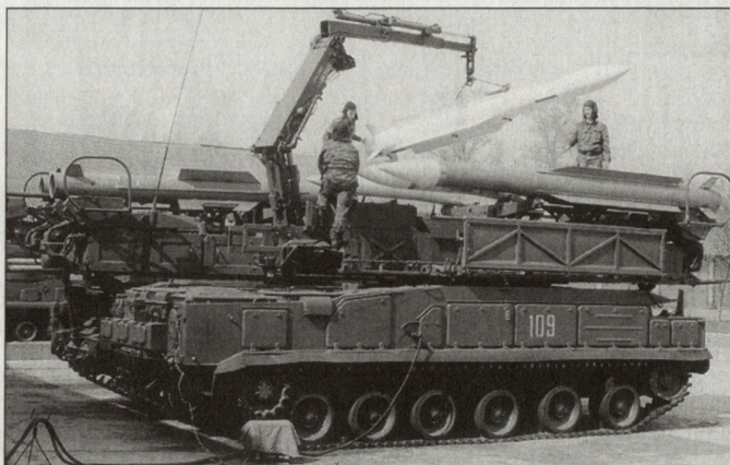
Modernisierung der russischen Streitkräfte lässt weiter auf sich warten (Bild: Flab System «Buk-M1»).