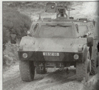
Gepanzertes Transportfahrzeug «Scarab» der British Army.

Vorerst müssen aber diese Zusatzkosten ausschliesslich über Sparmassnahmen aufgefangen werden. Vorerst ist davon vor allem die britische Navy betroffen. So soll das älteste der noch aktiven Kriegsschiffe, die «HMS Fearless», ausgemustert werden. Als nächste