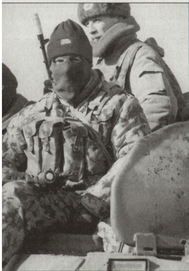
Russische Spezialtruppen in Tschetschenien.

Seit dem 11. September 2001 sind nur noch spärliche Informationen über den laufenden Konflikt in Tschetschenien verfügbar. In den letzten Wochen sind gemäss Militärquellen die russischen Streitkräfte dazu übergegangen, vermehrt mit Spezialtruppen gegen den tschetschenischen Widerstand vorzugehen. Offensichtlich werden dabei auch Er-