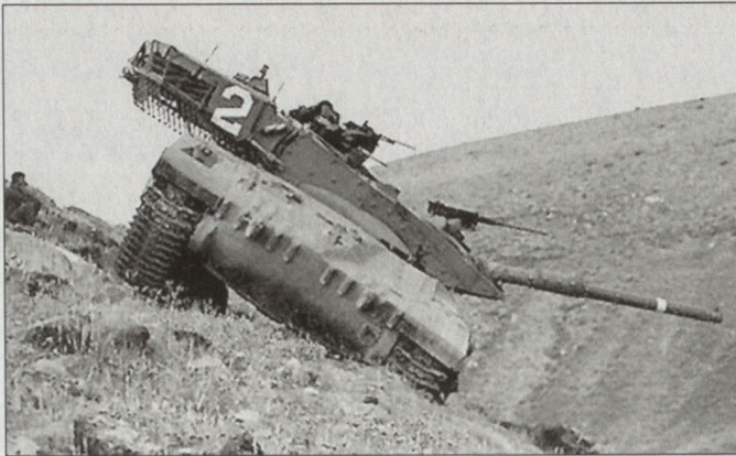
Kampfpanzer «Merkava Mk4».

■ Vollautomatisches Ladesystem mit 10 einsatzbereiten Geschossen unterschiedlicher Typen im Ladeautomat.