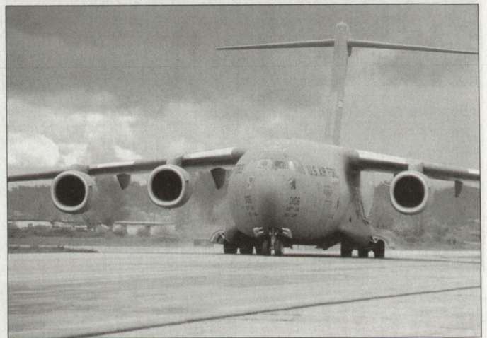
Strategisches Transportflugzeug C-17 «Globemaster III» der US Air Force.

Der Flugzeughersteller Boeing hatte bereits einen Auftrag zur Produktion von 120 Transportmaschinen C-17, die bis zum Jahre 2004 abgeliefert werden müssen. Bis heute sind davon rund 100 Maschinen ausgeliefert worden. Der neue Auftrag bringt für Boeing eine Auslastung bis 2008. Die Montagewerke in Long Beach (Kalifornien), in denen rund 7000 Beschäftigte arbeiten, bleiben nun von einer befürchteten Schliessung verschont. An mehreren anderen Produktionsstandorten sind weitere rund 3000 Arbeiter an der Produktion der Transportflugzeuge beteiligt. hg