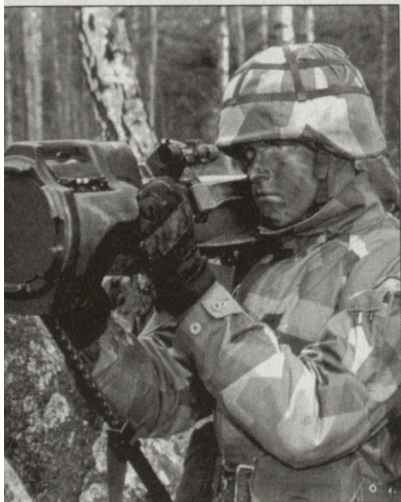
Die leichte Panzerabwehrwaffe NLAW.

Die Beschaffung der seit langem evaluierten neuen NLAW (Next-Generation Light Anti-Armour Weapon) für die British Army ist an die schwedische Firma Saab Bofors Dynamics vergeben worden. Der provisorische Vertrag