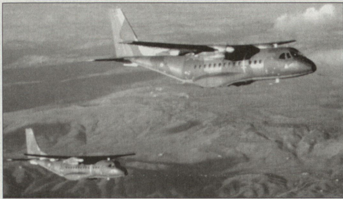
Transportflugzeug CASA CN-235.

hier hinzukommen. Die CN-235 erfüllt in den französischen Streitkräften die operationellen Anforderungen für den Transport geringerer Lasten über kurze und mittlere Einsatzdistanzen. Dabei werden diese Flugzeuge für Truppen- und logistische Lufttransporte – auch im Zusammenhang mit Auslandseinsätzen – verwendet. Mit dem Flottenmix aus CN-235, «Trans-