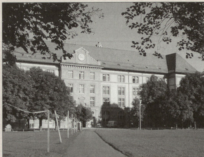
Die Mezener Kaserne Bern, Standort der neuen Führungsschule Einheit.

Fotos: Heinz Leuenberger, Informationschef Kdo AAL ■