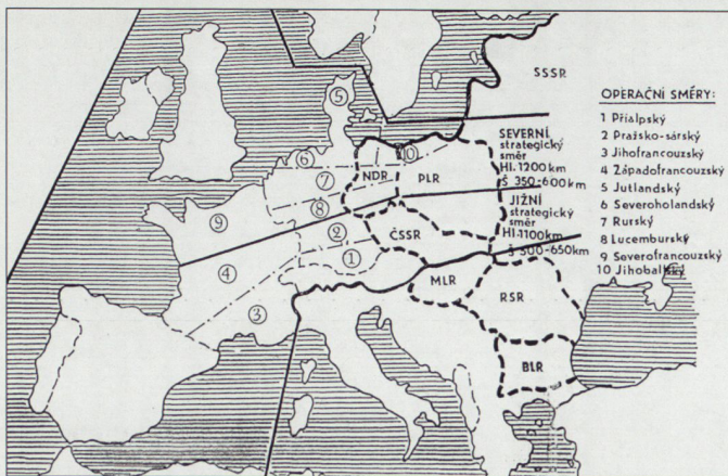
Einteilung der möglichen Kriegsschauplätze in Europa.