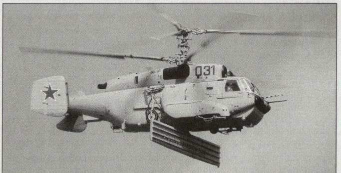
Produkte der russischen Luftfahrtindustrie: Überwachungshelikopter Ka-31.

Dominierende russische Firma im Kampfflugzeugbereich ist heute Suchoi. Es scheint, dass dieser Hersteller den langjährigen Konkurrenzkampf gegenüber den MiG-Werken zu seinen Gunsten entschieden hat. Neben zahlreichen anderen Typen nahmen von Suchoi die bekannten Prototypen an den Flugvorführungen teil, z.B. die S-37 «Berkut», die nunmehr unter der Bezeichnung Su-47 geführt wird. Vorgeführt wurde auch der dritte Prototyp des Zweisitzers Su-30MKI in der Version, wie sie nun an Indien geliefert werden soll. Dazu kam zum ersten Mal die Su-35UB, ebenfalls ein Doppelsitzer, der sich noch im Prototypenstadium befindet. Der Hersteller MiG beschränkte sich vor allem auf die Präsentation von kampfwertgesteigerten Maschinen der MiG-29-Serie sowie auf das