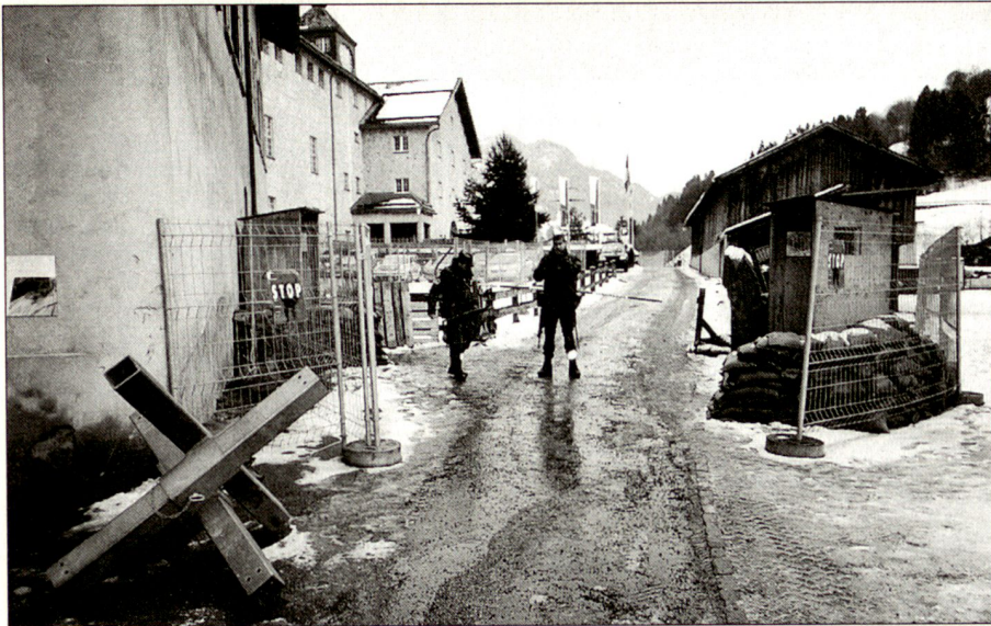
Gebirgsfüsilierkompanie III/236 bewacht ein gehärtetes Objekt