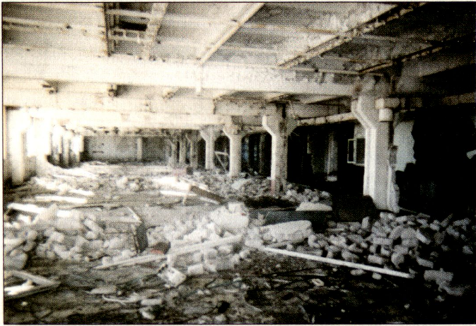
Das Innere des «Pentagons» heute.