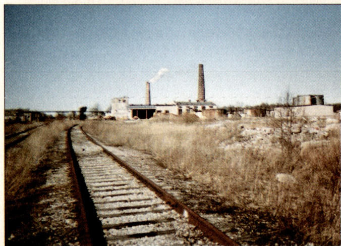
Die Überreste der Heizanlage. Der Boden ist sichtlich mit Öl verschmutzt. Fundamente weisen auf weitere Gebäude hin, welche aber beim Abzug der russischen Truppen abgerissen wurden.