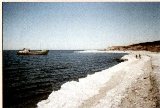
Blick auf ein Schiffswrack an der Küste von Paldiski. In Zusammenarbeit mit der Königlichen Schwedischen Marine und der Deutschen Bundesmarine hat die Estnische Marine in den letzten Jahren Blindgänger und andere Explosivkörper aus den Gewässern unmittelbar vor Paldiski geborgen.