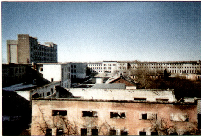
Der Innenhof des «Pentagons».