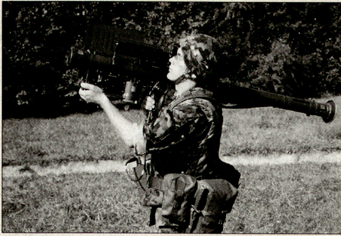
Leichte Fliegerabwehr-Lenkwaaffe BL 94 (Stinger).