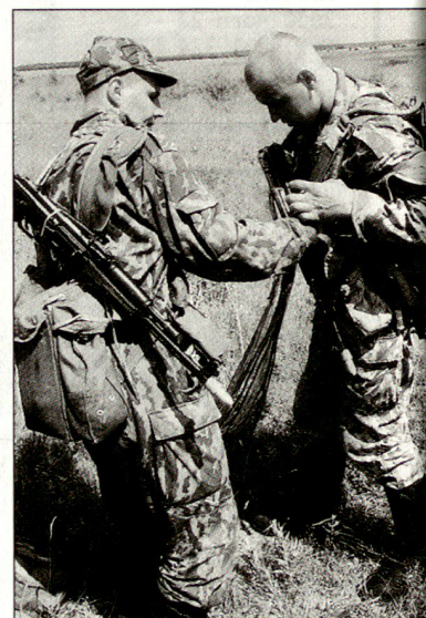
Russische Luftlandesoldaten der 76. Garde Luftlandedivision bei der Ausbildung. ■

mehrten Einsatz von Spezialkräften den Kampf gegen die Rebellen im tschetschenischen Bergland erfolgreicher führen zu können. Diese sollen an Stelle der bisher kämpfenden Einheiten der Truppen des Innern und der nicht sonderlich leistungsfähigen Mot Schützenverbände der Landstreitkräfte den Kampf weiterführen. Aber trotz verstärktem militärischen Einsatz hat sich die Sicherheitslage in Tschetschenien in den letzten Monaten nicht verbessert. hg