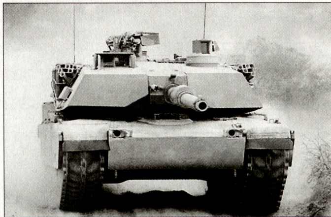
Kampfpanzer M1A2 SEP der US-Army.

FBCB2 (Force XXI Battle Command Brigade and Below). Die Komponenten dieses Lagedarstellungs- und -übermittlungssystems sind in sämtlichen Hauptwaffensystemen der Division, d. h. in den Kampfpanzern M1A2 SEP, Schützenpanzern M-2A3 «Bradley», Panzerhaubitzen M-109A6 «Paladin», Kampfhelikoptern AH-64 «Apache Longbow» usw. integriert. Die Ausrüstung in den Waffensystemen, u. a. auch im modernisierten Kampfpanzer M1A2 SEP (System Enhancement Package) besteht im Wesentlichen aus einem Farbbildschirm für die digitalisierte Lagedarstellung. Die Übermittlung der Daten erfolgt über das neue Funksystem SINCARS (Single Channel Ground & Airborne Radio System). Beim M1A2 SEP sind darüber hinaus auch Verbesserungen bei den Wärmebildgeräten und beim