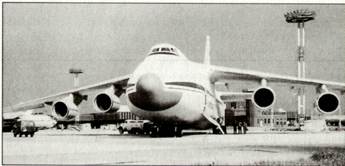
Ukrainisches Transportflugzeug An-124 «Ruslan».

Die An-124 wird von den russischen und ukrainischen Luftstreitkräften geflogen. Die auf ICAO-Standard umgerüstete Version An-124-100 wird heute von der Antonov Airlines im zivilen und militärischen Chartergeschäft erfolgreich eingesetzt. U.a. werden diese Maschinen auch zur Versorgung des deutschen ISAF-Kontingents in Kabul genutzt. Aus den vorgeschlagenen Typenvarianten und drei Beschaffungsmöglichkeiten (Kauf, Leasing, Charter) ergeben sich nun sechs Optionen, die nun im Detail analysiert werden. Bei der Entscheidung über diese Interimslösung für den strategischen Lufttransport in Europa sind sicherlich die Kosten massgebend; allerdings gilt es dabei auch wichtige sicherheitspolitische Gesichtspunkte zu berücksichtigen. hg