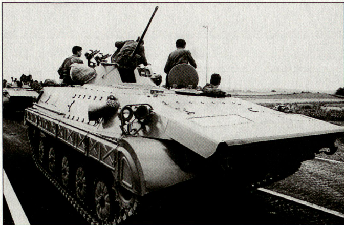
Schwierige Reform der serbischen Streitkräfte, Bild: Schützenpanzer M-60P der VSCG.

tion des Ministeriums eingeleitet worden ist, soll nun auch die Reform der Streit- und Sicherheitskräfte an die Hand genommen werden. Die personellen Reduzierungen innerhalb der VSCG dürf-