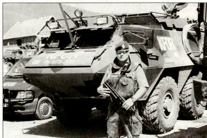
Die Streitkräfte der skandinavischen Staaten arbeiten bereits im Kosovo eng zusammen; Bild: finnischer Soldat der KFOR.

Darüber hinaus wird die NORDCAPS-Zusammenarbeit mit den baltischen Staaten intensiviert sowie ein isländisches CIMIC-Kontingente in die ge-