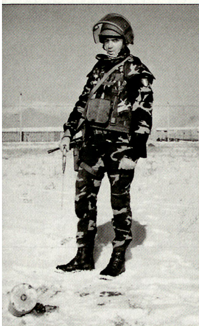
Italienischer Minenräumerspezialist beim Einsatz in Afghanistan.

In Bosnien sind zirka 1500, in Albanien 800, in Mazedonien 30 und im Kosovo 4700 italienische Soldaten im Einsatz. Weltweit leisten weitere 230 Soldaten Dienst im Rahmen der UNO. Die Beteiligung Italiens an ISAF in Afghanistan beträgt 450 Mann. Für die Operation « Enduring Freedom » sind derzeit noch rund 300 Mann im Einsatz (Fregatte und Transportflugzeuge).