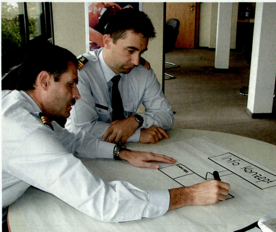
Kleingruppenarbeit im Zusatzausbildungslehrgang 2.