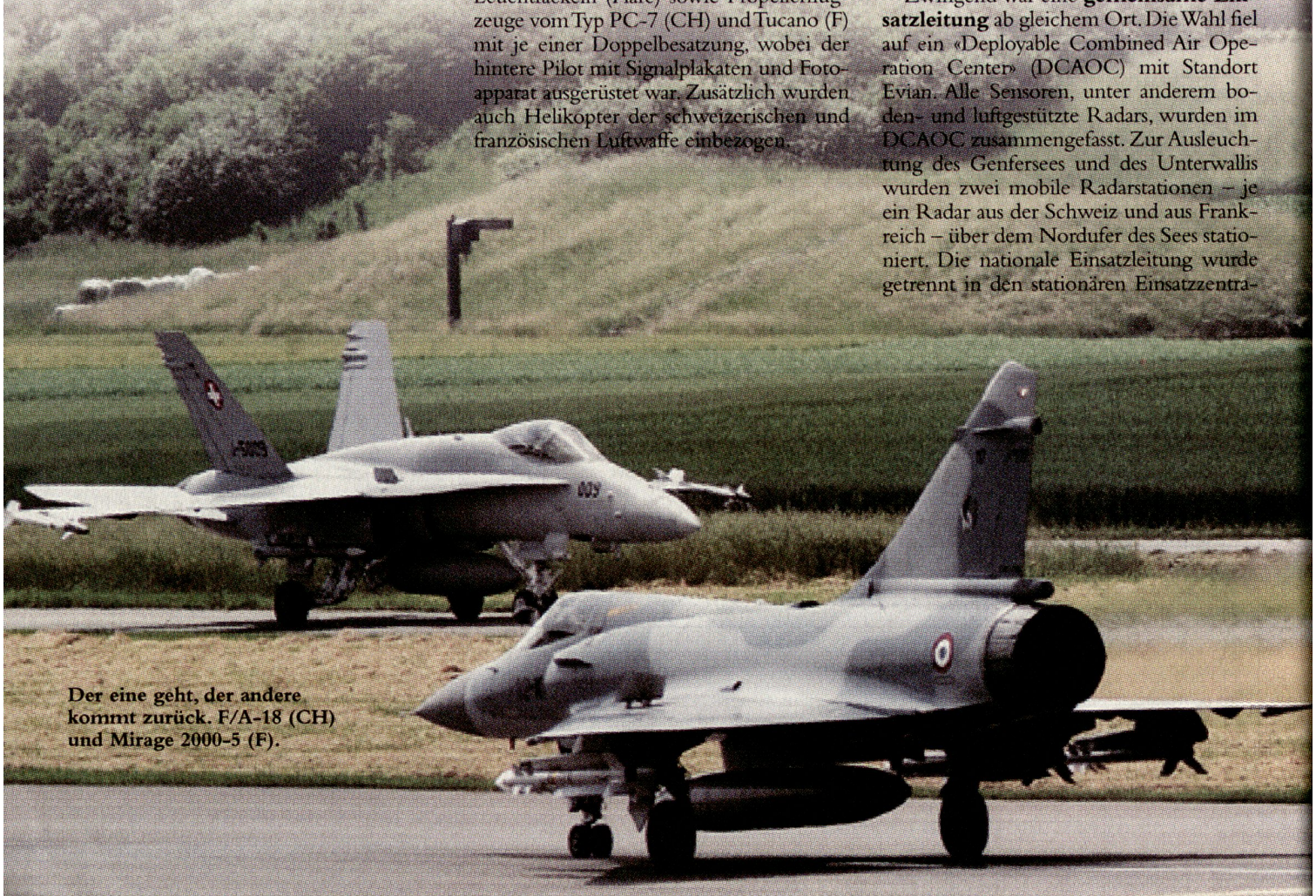
Der eine geht, der andere kommt zurück. F/A-18 (CH) und Mirage 2000-5 (F).

Zwingend war eine gemeinsame Einsatzleitung ab gleichem Ort. Die Wahl fiel auf ein «Deployable Combined Air Operation Center» (DCAOC) mit Standort Evian. Alle Sensoren, unter anderem boden- und luftgestützte Radars, wurden im DCAOC zusammengefasst. Zur Ausleuchtung des Genfersees und des Unterwallis wurden zwei mobile Radarstationen – je ein Radar aus der Schweiz und aus Frankreich – über dem Nordufer des Sees stationiert. Die nationale Einsatzleitung wurde getrennt in den stationären Einsatzzentra-