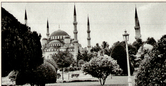
Sultan Ahmet-Moschee (Blaue Moschee) in Istanbul.