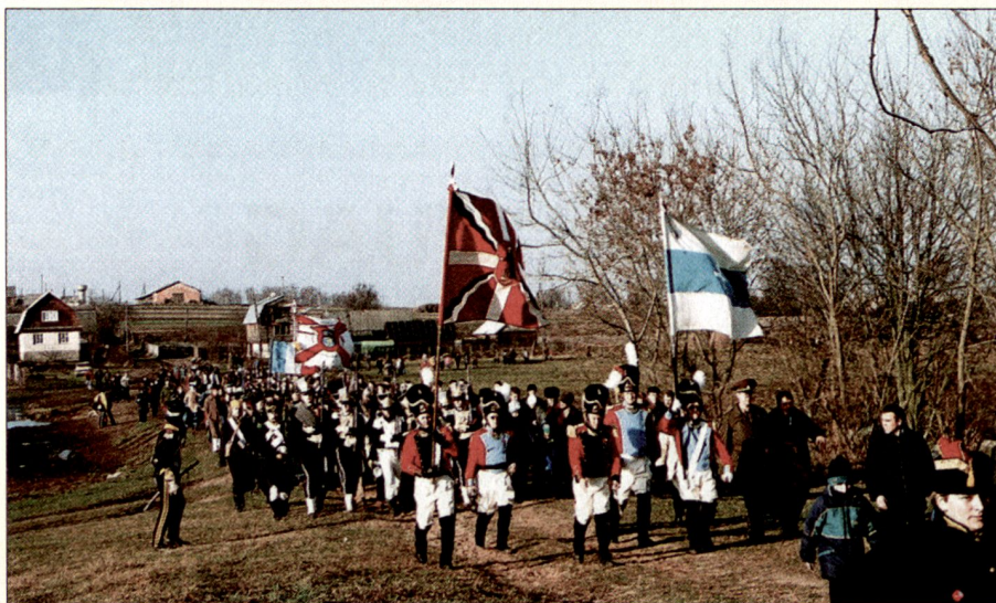
Aufmarsch der Truppen zur Rekonstruktion der Schlacht an der Beresina, im Vordergrund die Fahnen der Beresinagrenadiere des 3. und 4. Regiments der Glarner und Zuger.