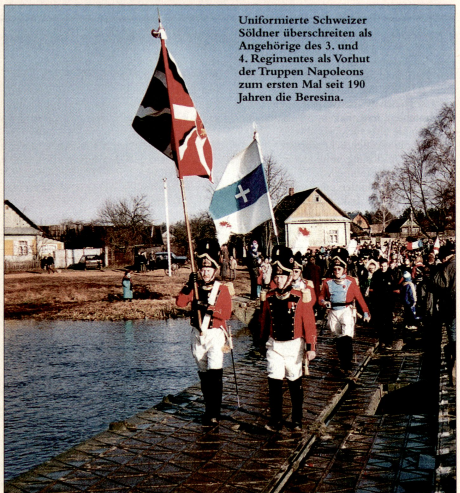
Uniformierte Schweizer Söldner überschreiten als Angehörige des 3. und 4. Regiments als Vorhut der Truppen Napoleons zum ersten Mal seit 190 Jahren die Beresina.

Oberhalb von Borisov, beim Dorf Studjanka, gestattete eine Furt von zirka 1,5 m Tiefe trotz grosser Kälte und Eisschollen den Bau von Bockbrücken. Als Baumaterial dienten Holzbalken von in der Umgebung abgebrochenen Häusern. Am 26. November 1812, um 13 Uhr, war die erste der beiden Brücken fertig. Das II. Armeekorps, das neben den Schweizern auch Polen, Kroaten und Franzosen umfasste, überquerte sogleich den Fluss, um auf der gegenüberliegenden Seite einen Brückenkopf zu bilden und zu halten. Die erfolgreiche Verteidigung gegen eine starke Übermacht ist die grosse militärische Leistung an der Beresina. Kurz vor dem Hauptkampf vom 28. November stimmte noch Leutnant Legler sein Lieblingslied an, welches fortan das Beresinalied genannt wird: Unser Leben gleicht der Reise – eines Wandrers in der Nacht usw. Infolge Munitionsmangels der Verteidiger rückten