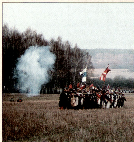
Die Rekonstruktion der Schlacht in vollem Gange. Links unterstützt die Artillerie den Truppenaufmarsch. Im Hintergrund rechts stossen Verstärkungen über die Beresina.

Heute gehört das Gebiet um die Beresina zu Weissrussland. Dort zeigt man sich bereit, die Geschichte neu aufzuarbeiten. Mit einer riesig aufgemachten Rekonstruktion