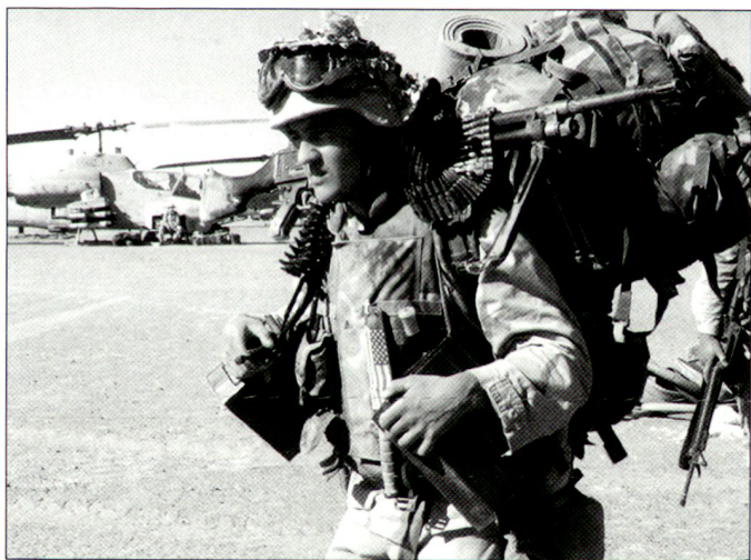
Hohe Belastung für die Truppen der US Army und des US-Marinekorps.

Verteidigungsminister Rumsfeld will vorerst die Ausland-