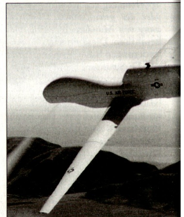
«Global Hawk» wurde u.a. auch erfolgreich in Afghanistan eingesetzt.

Im Verlaufe der Entwicklungsphase wurden unter dem so genannten ACTD-Programm (Advanced Concept Technology Demonstration) sieben Flugzeuge der