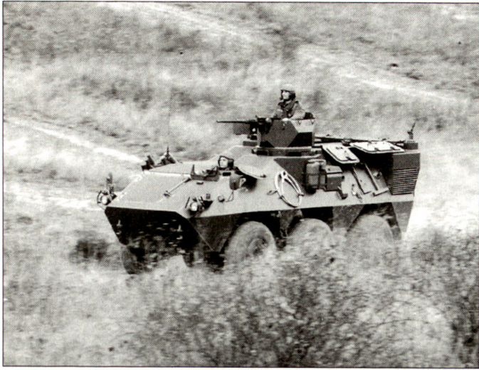
Mechanisierte Infanterie bildet das Rückgrat der österreichischen PSO-Einsatzkräfte.

auch auf Aufgaben im oberen Spektrum vorbereitet werden. Dieses erweiterte Aufgabenspektrum soll von reinen Überwachungs- und Schutzaufgaben über Aufgaben im Rahmen humanitärer Unterstützung bis hin zu Kampfaufgaben (beispielsweise beim Schutz von Zivilbevölkerung, der Trennung von Konfliktparteien oder der gewaltsamen Durchsetzung von Mandaten) künftig alles beinhalten. Diese erweiterten Anforderungen haben Konsequenzen auf die Strukturen und vor allem die Ausrüstung der dafür vorgesehenen Truppen. Es ist daher beabsichtigt, mindestens Teile dieser Kräfte als stehende Einheit auf Basis von Berufssoldaten (Kaderpräsenzeinheiten mit hohem Kampfwert) in der Streitkräftegliederung aufzubauen. Grund-