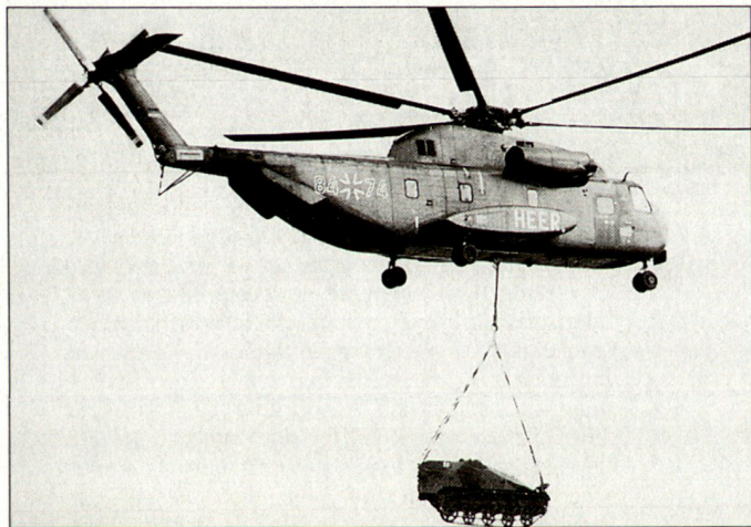
Transporthelikopter CH-53 des deutschen Heeres.

zum abhörsicheren Sprechfunk installiert. Künftig sollen die Helikopter auch mit einem Voice-Recorder ausgerüstet sein. Nach Angaben der deutschen Bundeswehr ist vorgesehen, bis zum Jahre 2006 in einem Folgeauftrag zunächst weitere 39 Maschinen des Typs CH-53 serienmässig aufzurüsten. Diese langfristige Investition, die vom BMVg mit «Massnahmen zur Sicherstellung der Einsatzbereitschaft» beschrieben wird, sei notwendig, um das Gesamtsystem bis etwa 2030 technisch sicher operationell betreiben zu können. hg