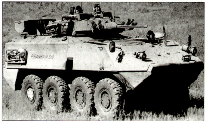
Schützenpanzer «Piranha IIIC».

Dies ist bereits der zweite Vertrag von Mowag mit den dänischen Streitkräften. Die erste Bestellung umfasste 22 Schützenpanzer der Version «Piranha IIIH», welche in den Jahren 1999 bis 2000 ausgeliefert wurden. hg