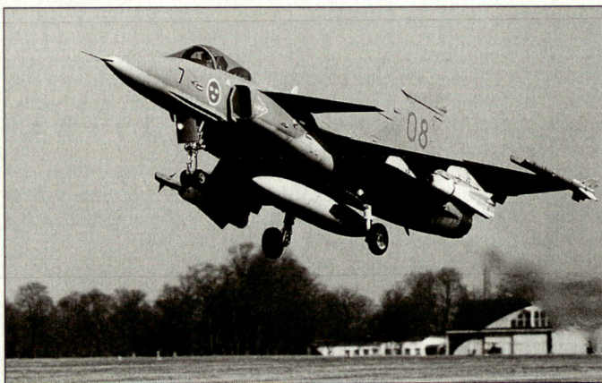
Leasing von schwedischen Kampfflugzeugen Jas-39 «Gripen» und Kauf moderner Bewaffnung für die ungarische Luftwaffe. (Bild: «Gripen» mit Lenkwaffen «Sidewinder» und «Maverick».)

Grundversion RQ-4A gebaut. Diverse dieser Typen standen in den vergangenen Konflikten im Einsatz, wobei auch Verluste zu beklagen waren. Der Einsatz von strategischen Aufklärungssystemen «Global Hawk» im Verlaufe der Operationen «Enduring Freedom» und «Iraqi Freedom» hat den US-Streitkräften nicht nur wertvolle Aufklärungsergebnisse, sondern auch interessante Erfahrungen mit Blick auf deren Weiterentwicklung gebracht. Unterdessen hat «Global Hawk» von der amerikanischen Luftfahrtbehörde auch die Bewilligung erhalten, im US-nationalen Luftraum zu operieren. Dies eröffnet diesem Aufklärungssystem neue Einsatzmöglichkeiten im nichtmilitärischen Bereich (z.B. bei der Küstenwache oder der «homeland security»). hg