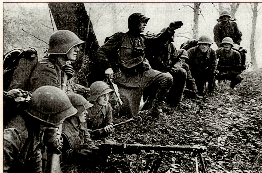
Auftragstaktik in der Armee 61 auf gefechtstechnischer Stufe: Führung vor Ort, das Ziel vor Augen ...

Zur Auftragstaktik gehören eindeutig innere Werte und Errungenschaften einer modernen Zivilisation. Werte, wie sie der politisch mündige Bürger in Uniform entweder mitbringt oder wie sie im Militärdienst vermittelt werden. Gerade Letzteres darf nicht unterschätzt werden. Es geht darum, auf allen Stufen das selbstständige Handeln innerhalb einer bekannten höheren Absicht zu fördern. Dies entstammt auch der Einsicht von Clausewitz und Moltke, nach der es im Krieg entscheidend darauf ankomme, mit Sicherheit auftreten-