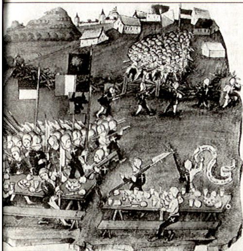
Zürichkrieg 1444. Überfall der Zürcher auf die tafelnden Eidgenossen (Hirzel-Letzi). Auf deren Spruchband: «Woll um woll an, wir wellend aber dran.»