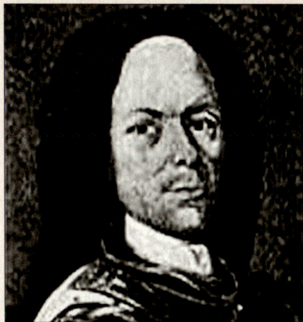
Bataillonskommandant Fankhauser. Die Schicksalsstunde spüren – und handeln. (Villmergen 1712)

Fankhauser als rechte Flankensicherung ohne Verbindung zum Gros ab. Ein schlecht koordinierter Zangenangriff der Katholiken brachte alsdann die Berner in höchste Bedrängnis. Die nun durch das Gelände benachteiligten Berner wichen, die Situation drohte in Panik überzugehen. Fankhauser begriff, dass sein Auftrag in Ammerswil durch eine neue Lage überholt sein könnte und rückte ohne Befehl Richtung Gefechtslärm vor. Seine 800 Mann kamen gerade zur rechten Zeit an, um einem verzweifelten Gegenangriff der Berner zum entscheidenden Erfolg zu verhelfen.