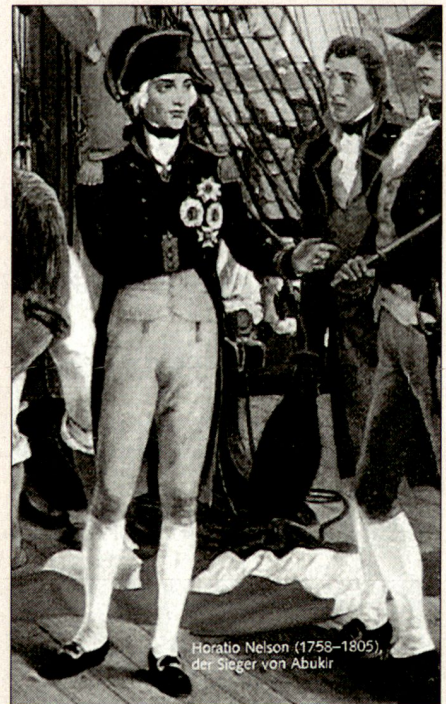
Admiral Nelson. Wohl das berühmteste Flaggensignal in der Seekriegsgeschichte erging 1805: «England erwartet, dass jeder Mann seine Pflicht tut.»