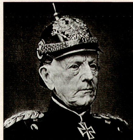
Generalfeldmarschall von Moltke. Wie Scharnhorst lehnte auch er so genannte «unfehlbare» Prinzipien und schablonenartiges Denken ab.

Die taktische Umsetzung in Deutschland hinkte noch etwas hinterher. Die bewährte Operationskunst stand im Kontrast zu alten Vorstellungen des Infanterieangriffes: linear aufgestellte Verbände nebeneinander, ohne Tiefe für eigene Manöver und entsprechende Raumverantwortung bzw. Handlungsfreiheit. Die Exerzierreglemente für die Infanterie von 1888 und 1906 brachten den Paradigmawechsel. Der Gefechtserfolg wurde fortan als Summe aller Teilerfolge im Sinne der Auftrags-taktik gesehen. Die Befürchtung, das Gewähren von Handlungsfreiheit verhindere die zeitliche und räumliche Einheitlichkeit vor allem im Angriff, wurde auch durch die Erfahrungen im Burenkrieg und im Russisch-Japanischen Krieg zerstreut.