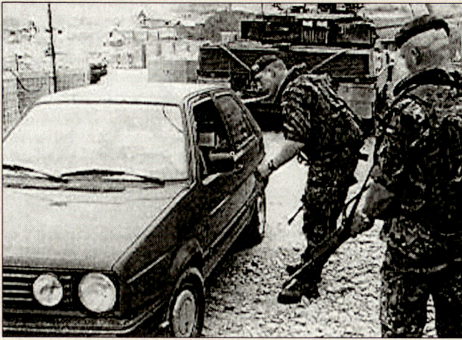
Auf sich gestellt: Kontrollposten der KFOR, Kosovo 2001.