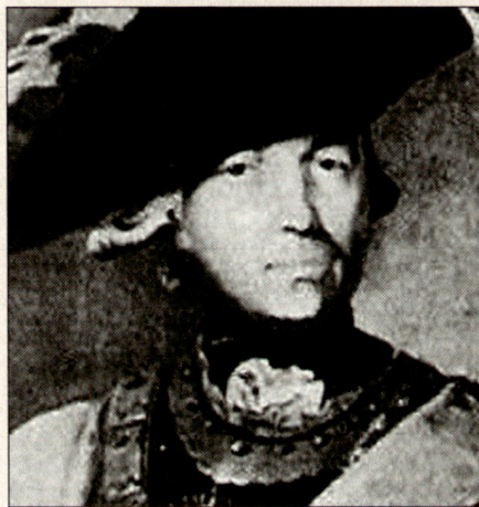
General von Seydlitz: «Nach der Schlacht kann der König über meinen Kopf verfügen. Während der Schlacht möchte ich ihn zu seinem Vorteil selber gebrauchen». (Zorndorf 1758)