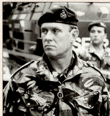
General Jack Deverell, Kommandant NATO-Streitkräfte Nord (Brunssum).

Das Kommando der Luftstreitkräfte und des rückwärtigen Raumes wurde vom NATO-Hauptquartier Nord gestellt, wäh-