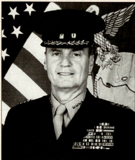
General James Jones, der NATO-Oberbefehlshaber in Europa.

Zu Beginn der «heissen» Übungsphase erhielt der Kommandant der GFOR den