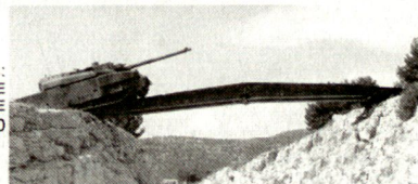
PAR 70 : GESCHLEPPT SCHNELLBRÜCKE Klasse 70

FIRMENSITZ : 35, rue de Bassano - 75 008 - PARIS - FRANCE