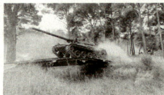
TCP : KURZBRÜCKE Klasse 65