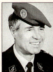
Ulrich Jeanloz, Divisionär, Direktor des Bundesamtes für Unterstützungstuppen (BAUT), 3000 Bern.

Unsere Geländeverstärkungen haben neben den rein operativ-taktischen Gesichtspunkten auch eine hohe ideelle Bedeutung. Der heutige Zustand unserer Festungskanonen und Festungsmine werfer darf als einwandfrei bezeichnet werden. Einige Anlagen werden zu Ausbildungszwecken weiterhin voll und ganz einsatzbereit gehalten. Bei den anderen Anlagen ist eine ausgewogene Optimierung des Unterhaltsaufwands mit der prognostizierten Zeit für eine allfällige Wiederinbetriebnahme bei einem Anstieg der Bedrohung zu realisieren. Ein Totalverzicht ist zum jetzigen Zeitpunkt nicht vorgesehen. ■