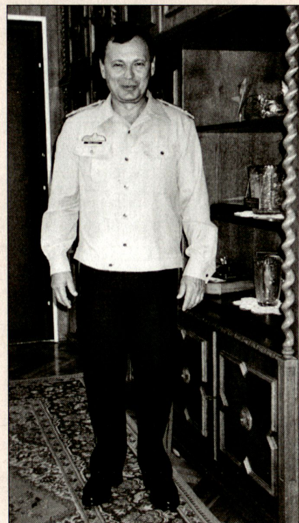
Generalmajor Imre Balogh, Kommandant der ungarischen Luftwaffe, Veszprém, Ungarn.

Es bestehen weitere Beispiele für die Ausnützung Ungarns durch die USA. So könnten die bescheidenen finanziellen Mittel, über die Ungarn für seine Streitkräfte verfügt, für den Erwerb amerikanischer Waffen besser verwendet werden. Zum Beispiel könnte sich Ungarn an der Entwicklung und Indienststellung des