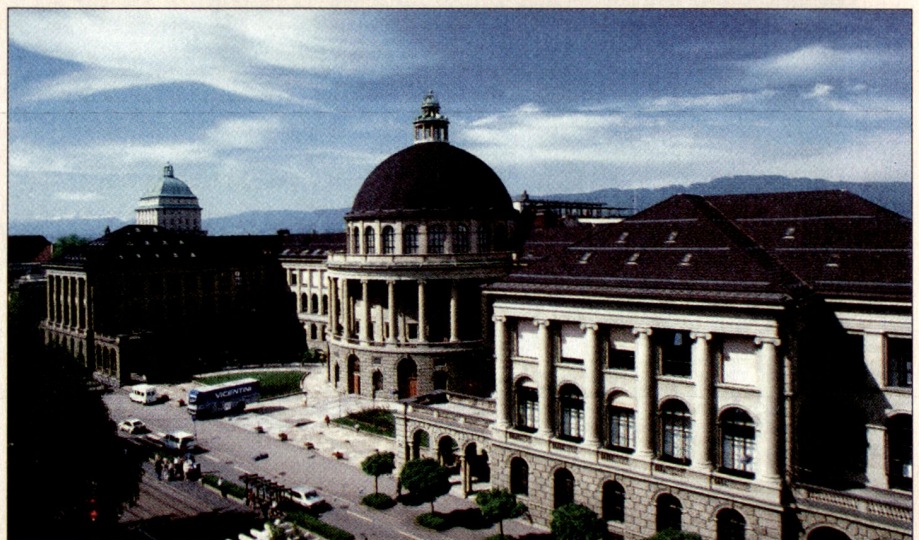
Hauptgebäude der ETH Zürich.

Die gesellschaftliche Bedeutung dieses Berufes und die intensive Zusammenarbeit mit Menschen verlangen, dass die Berufsoffiziere Charakter und Persönlichkeit mit-