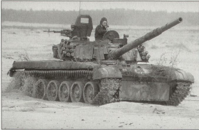
Die polnische Armee verfügt noch über eine grosse Anzahl von Kampfpanzern T-72; nur ein kleiner Teil davon soll NATO-kompatibel gemacht werden.

600 T-72M1. Insbesondere die PT-91 sind noch relativ neu und verfügen über Leistungsreserven. Mit der Einführung der «Leopard 2A4» konnte nebst einer unmittelbaren Leistungssteigerung bei der Panzertruppe auch eine rasche Kompatibilität zu analogen NATO-Kräften erreicht werden. Andererseits muss mit dieser Einführung auch der Aufbau einer zweiten logistischen Basis in Kauf genommen werden. Geplant ist im Weiteren, dass in den nächsten Jahren ein Teil der östlichen Panzer auf das westliche Kaliber 120 mm umgerüstet werden soll. Vorgesehen ist der Einbau der deutschen Kanone L44 mit dem entsprechenden Munitionszuführungs-