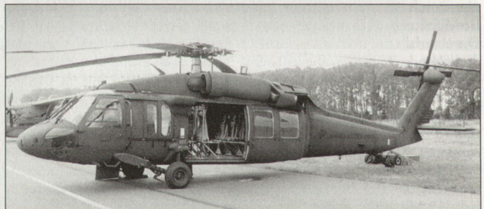
Transporthelikopter UH-60 «Black Hawk» bei der US Army.

Vorgesehen ist, dass die Produktion aller wesentlichen Komponenten sowie auch die Endmontage für die Helikopter UH-60 «Black Hawk» (internationale Exportbezeichnung S-70) in der Türkei vorgenommen wird. Dabei ist mit einer jährlichen Produktion von 20 bis 40 Helikoptern zu rechnen, die vor allem für den weltweiten Export vorgesehen sind. Die türkischen Streitkräfte verfügen heute über rund 50 Helikopter «Black Hawk» der Version S-70A. Vorgesehen ist ein Bestand von 100 Maschinen dieses Typs. Der «Black Hawk» wird heute weltweit in diversen Armeen genutzt. In Europa verfügen nebst der Türkei auch Griechenland und Österreich über Helikopter dieses Typs. hg