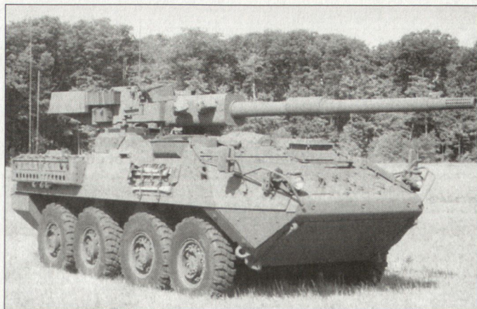
Radpanzer «Stryker» in der Version «Mobile Gun System».

rechtlicher, militärischer und anderer Mittel sei erforderlich. Die «Europäisierung» als strategisches Ziel und Reformen werden zur Sicherung der eigenen Nachbarschaft empfohlen. Dabei habe die Lösung des Nahostkonfliktes für Europa strategische Priorität. Die Formulierungen über die Rolle der Vereinten Nationen wurden gegenüber der früheren Fassung verstärkt. Es heisst: «Wir verpflichten uns zur Aufrechterhaltung und Weiterentwicklung des internationalen Rechts. Den entscheidenden Rahmen für die internationalen Beziehungen bildet die Charta der Vereinten Nationen.» Tp.