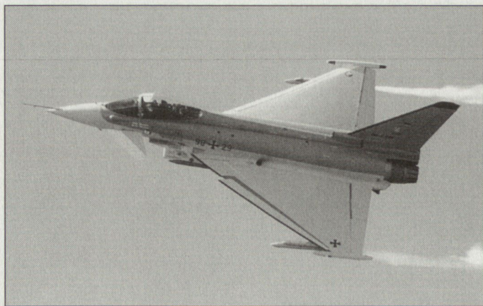
Das neue Reformkonzept für die Bundeswehr beinhaltet auch Kürzungen bei den Rüstungsvorhaben. Zur Diskussion steht eine Reduktion bei den geplanten 180 neuen Kampfflugzeugen Eurofighter.

Gemäss Verteidigungsminister Struck ist die Ausserdienststellung aller «Hawk»- und «Roland»-Verbände bis spätestens 2006 eine logische Konsequenz der verteidigungspolitischen Richtlinien Deutschlands und ein Baustein im Transformationsprozess der Bundeswehr. Zur Abwehr von Flugkörpern in grösseren Entfernungen und Höhen verbleibt das Lenkwaffensystem «Patriot» in der Luftwaffe. Auch bei diesen Verbänden sind aber Umstrukturierungen mit gewissen Standort-schliessungen vorgesehen. Auf die Beschaffung neuer Flugkörper «PAC-3» für das «Patriot»-System, die auch zur Abwehr ballistischer Raketen vorgesehen sind, wird vorderhand verzichtet. Das gilt