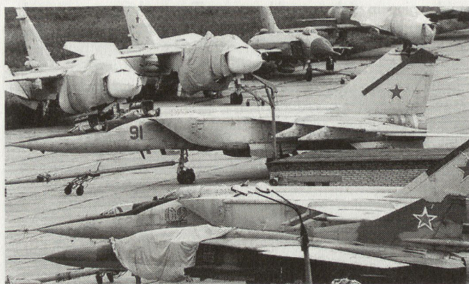
Die Masse älterer Typen wurden bis Ende der 90er-Jahre ausgemustert und stillgelegt.

tens die internationale militärische Zusammenarbeit. 14 Sie sind Ausdruck des Reformverständnisses unter Präsident Putin. Bereits vor seiner Wahl zum Präsidenten im März 2000 unterzeichnete er Anfang Januar 2000 ein neues Sicherheitskonzept, das jenes von 1997 ersetzt. Gemäss der Neufassung behält sich Russland den Einsatz von Nuklearwaffen vor, wenn im Falle einer bewaffneten Aggression alle anderen Mittel erschöpft sind oder sich als unwirk-