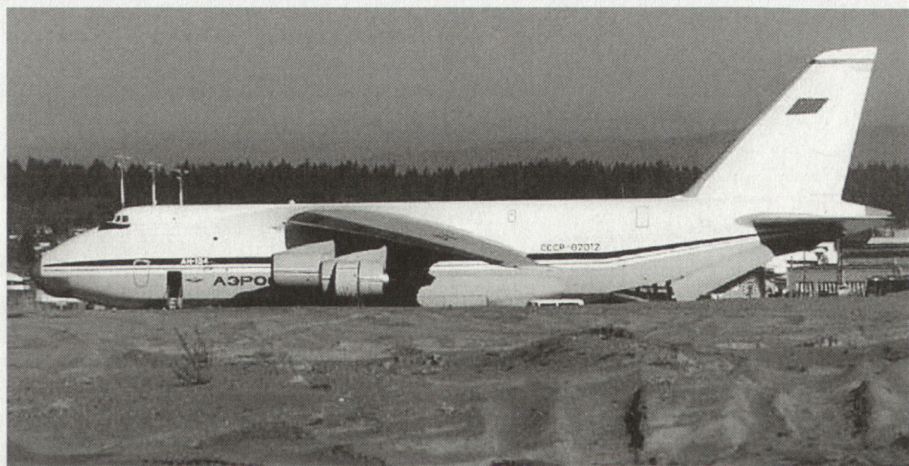
Kreative Finanzierungsmodelle sind nicht das exklusive Vorrecht des Westens: Die An-124 der Transportflieger bringen begehrte Devisen über kommerzielle Kontrakte und ermöglichen die kostengünstige Erhaltung militärischer Lufttransportkapazitäten (trotz Aeroflot-Anstrich ist diese An Teil eines Regiments der russischen Luftwaffe).