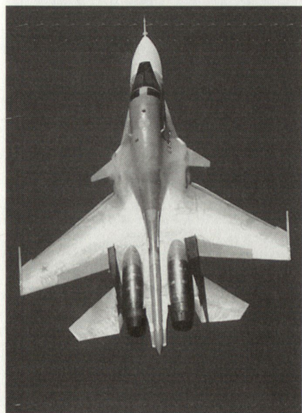
Die Su-27 IB/Su-34 soll als Weiterentwicklung der Su-27 der russischen Luftwaffe Präzision, Reichweite und Nutzlast in der Luft-Boden-Rolle bringen.

Das wichtigste Dokument ist die Militärdoktrin, die am 21. April 2000 verabschiedet worden ist. Drei Ereignisse dürften 1999 bei der Entstehung dieses Dokumentes eine wesentliche Rolle gespielt haben: