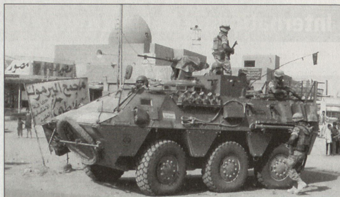
Spanischer Schützenpanzer BMR-M1 im irakischen Nadschaf.

Zunächst wurde in zwei Workshops ein multinationales Entwurfsdokument zu der Thematik «Beeinflussung der gegnerischen Wahrnehmung» (Perception Management Activities) erarbeitet. Die Teilnehmer hatten sich das Ziel gesetzt, das gemeinsame Verständnis von «Effect Based InfoOp» zu fördern und anhand von Fallbeispielen zur InfoOp-Konzeptentwicklung beizutragen. Letztendlich sollen «InfoOp» in zukünftigen multinationalen militärischen Einsätzen mit grösstmöglicher Effektivität eingebunden werden können. Hauptfragen in diesem Zusammenhang sind die Planung und Organisation künftiger «InfoOp» sowie Leistungsvermögen und analytisches Können des im Bereich «InfoOp» eingesetzten Personals. Dazu kommen vermehrt auch rechtliche Aspekte und andere Einschränkungen, die bei Informationsoperationen zu berücksichtigen sind. hg