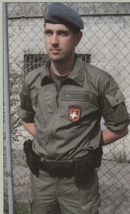
AdA Mil Sich im Tenue «olive».

Die dem Heer unterstellte Mil Sich arbeitet armeeseitig eng zusammen mit: Oberauditorat, PST A, FST A, Kdo Ausb