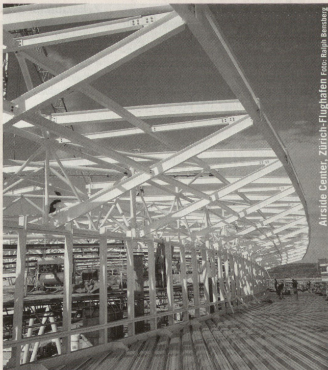
Airside Center, Zürich-Flughafen

FHS E. Frech-Hoch AG, Reuslistrasse 29, CH-4450 Sissach Telefon 061 976 66 66, Telefax 061 976 66 00 e-mail: info@frech-hoch.ch, www.frech-hoch.ch