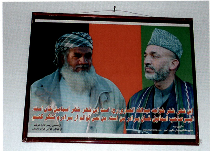
Ismael Khan und Hamed Karzai. Wie stark ist die Zentralregierung?

Institut sollte die wirkliche Situation in Afghanistan analysieren und der afghanischen Regierung und den Institutionen innerhalb von Afghanistan mit Ratschlägen zur Seite stehen. Ich weise darauf hin, dass Afghanistan bald einen schlechten Ruf haben und von der ganzen Welt geächtet sein wird, wenn gegen den Drogenanbau und den Drogenhandel nichts unternommen wird. Leider ist, seitdem die so genannten «Freunde» nach Afghanistan gekommen sind, der Drogenanbau gestiegen und nicht gesunken.