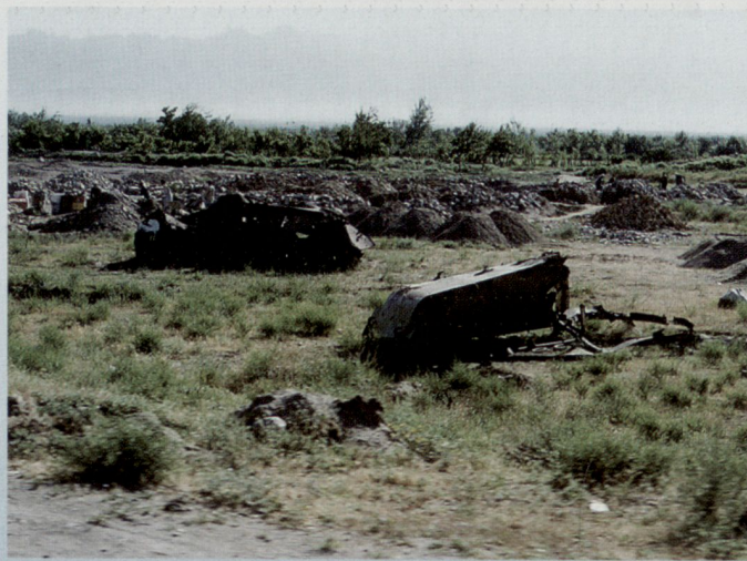
Zerstörter Talibanpanzer in der Shomali-Ebene nördlich Kabul.