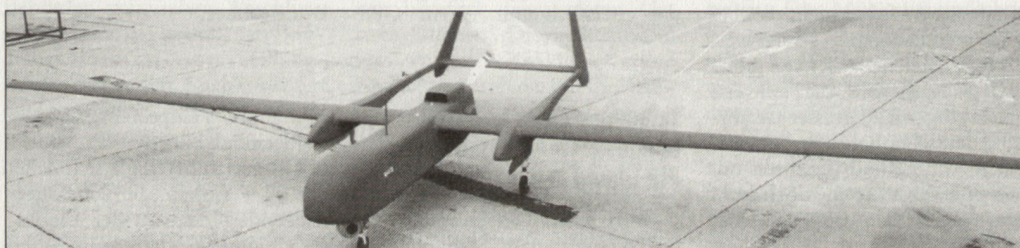
UAV «Eagle 1» der französischen Streitkräfte.

Der Irakkrieg habe aufgezeigt, so wird vom britischen Verteidigungsministerium erwähnt, dass es neben der Notwendigkeit von schweren Landstreitkräften und leichten infanteristischen Einheiten auch mobile mittlere Kräfte in Verbindung mit verbesserter Einsatz- und Kampfunterstützung geben müsse. Die neue britische Konzeption des «Future Rapid Effect System» (der so genannten Kampffahrzeugfamilie FRES) soll diesem Bedürfnis Rechnung tragen. Die stra-