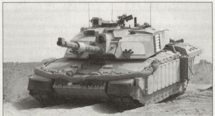
Kampfpanzer «Challenger 2» während des Irakkrieges.

Der Bericht unterstreicht, dass sich die Bewaffnung und Ausrüs-