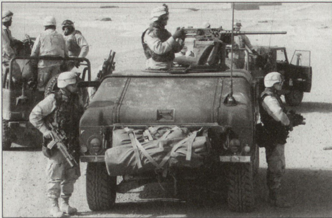
Die neuen Krisenregionen haben einen Umbau der US-Streitkräfteedislozierungen zur Folge. (Bild US-Truppen im Irak).

80 000 Soldaten (Amerikaner, Franzosen und Deutsche) verloren.