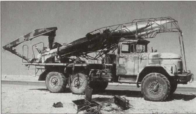
Die vorgängige Ausschaltung der Luftverteidigung (Bild zerstörte irakische Flab-Lenk Waffen) war ein wesentlicher Grund für den raschen Erfolg der Koalitionsstreitkräfte.

tegische Verlegbarkeit soll mit dem geplanten Kauf von 25 Transportflugzeugen A400M und dem weiteren Ausbau der strategischen Seetransportmittel verbessert werden. Der Bericht zeigt deutlich auf, dass Grossbritannien gewillt ist, die