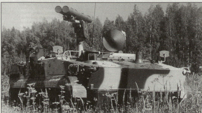
Russisches PAL-System AT-15 «Khrizantema».

Interessanterweise verfügt das PAL-System über zwei unterschiedliche Lenkverfahren: Funkkommando- und Laserleitstrahl lenkung. Dadurch lassen sich mit zwei Lenkflugkörpern innerhalb einer minimalen Zeitdifferenz zwei unterschiedliche Ziele bekämpfen. Das Waffensystem AT-15 kann insgesamt 15 Lenkflugkörper mitführen, die über verschiedene Gefechtskopfformen (Hohlladung, Tandemhohlladung, thermobarisch) verfügen. Vor allem der Einsatz von thermobarischen Gefechtsköpfen (siehe auch ASMZ 12/2001, Seite 42) dürfte dem PAL-System «Khrizantema» – zusammen mit der Allwetterfähigkeit und der niedrigen Störanfälligkeit – neue Einsatzmöglichkeiten eröffnen. Gemäss Äusserungen des russischen Verteidigungsministeriums soll im nächsten Jahr trotz bisher ausbleibenden Exportmöglichkeiten eine reduzierte Serienproduktion zu Gunsten der russischen Armee aufgenommen werden. hg