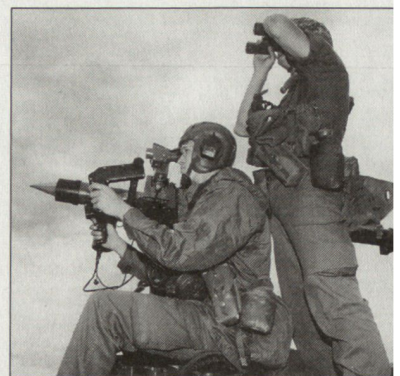
Flab-Lenkwaffensystem «Mistral» beim österreichischen Bundesheer.

An diesem erfolgreichen Gefechtsschiessen waren nicht nur hohe Offiziere des österreichischen Bundesheeres anwesend, sondern auch eine ungarische und polnische Delegation, die von den ausgezeichneten Trefferleistungen beeindruckt waren. In Zukunft will die österreichische Fliegerabwehrtruppe weitere Gefechtsschiessen auf dem polnischen Übungsplatz in Ustka durchführen. hg