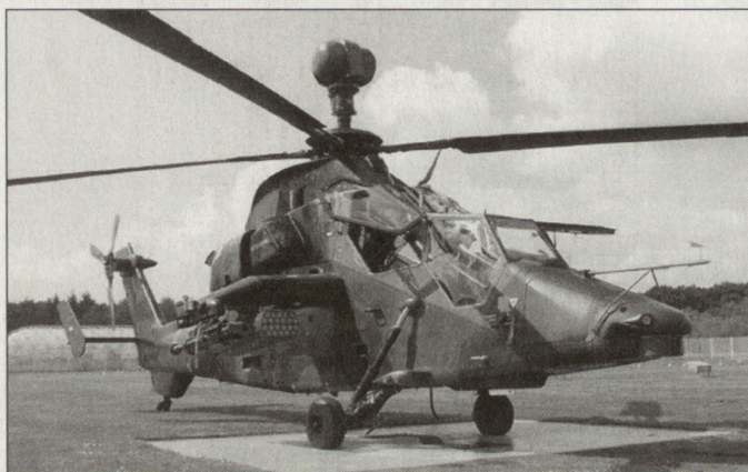
Kampfhelikopter «Tiger», eine Entwicklung der europäischen Rüstungsindustrie.

copter sind unterdessen Aufträge für insgesamt 206 Kampfhelikopter «Tiger» eingegangen. Davon entfallen je 80 für die beiden gros-