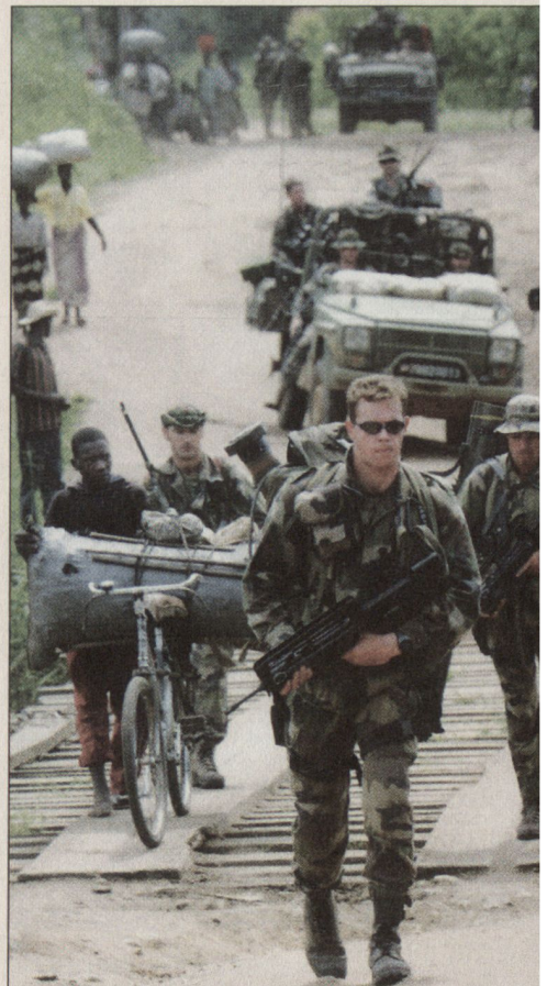
Aufklärungspatrouille in Bunia.

– Ein beachtlicher Erfolg der Operation war sicherlich die schnelle Entsendung der Truppen nach Bunia trotz komplexen logistischen Problemen und einem schwierigen sicherheitspolitischen Umfeld. Zu Beginn der Operation konnte der Flugplatz von Bunia nicht gebraucht werden, und die Truppen und Korpswaffen mussten deshalb über eine Fliegerbasis in Entebbe disloziert werden. Der Lufttransport wurde mit C-130- und C-160-Transportflugzeugen durchgeführt, die von Kanada, Belgien und Brasilien zur Verfügung gestellt wurden.