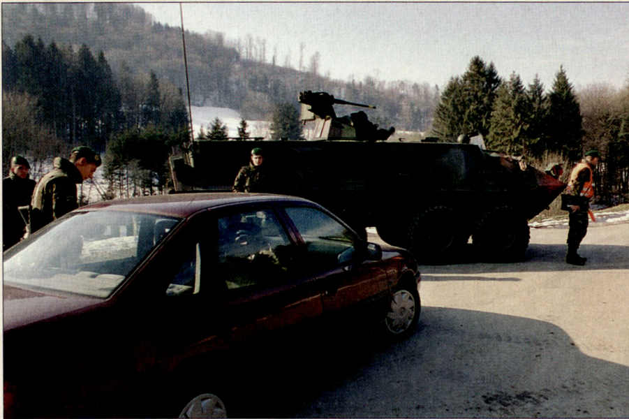
Angehörige der DD Inf Ber Kp 204 bei der Demonstration eines Checkpoints: Gerade im Rahmen der Weiterentwicklung der Armee spielen Durchdiener eine zentrale Rolle.

dienern bestehen, neu die Möglichkeit, bereits frühzeitig mit der einsatzspezifischen Ausbildung zu beginnen.