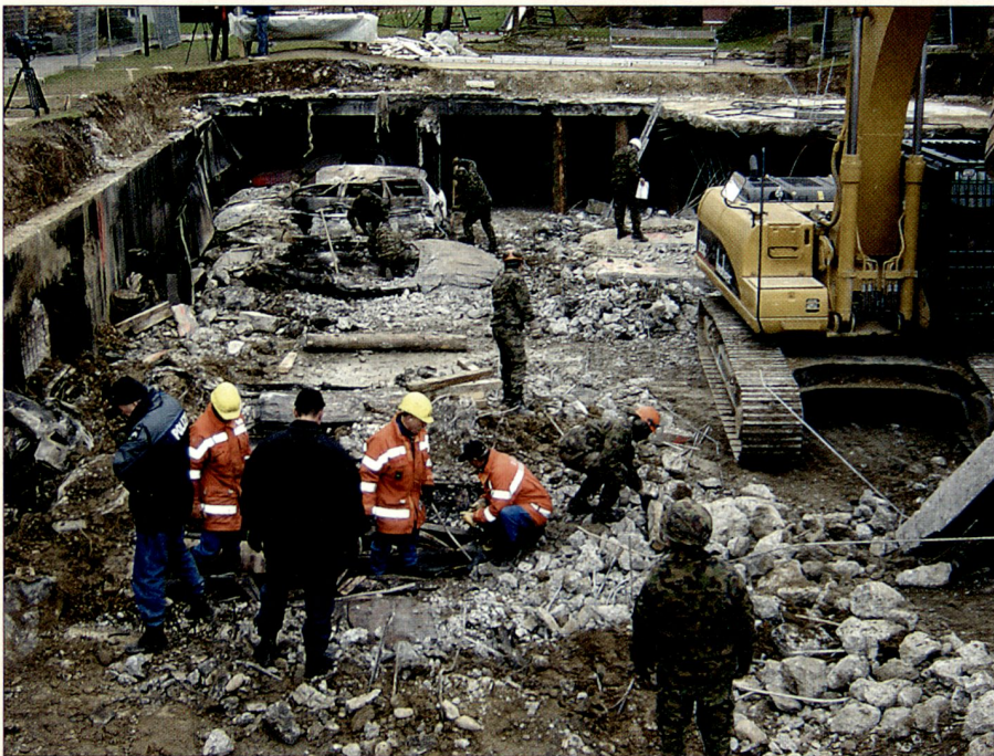
Einsatz des Katastrophenhilfe-Bereitschaftsverbandes in Gretzenbach (SO) nach einem Einstellhallenbrand 2004.