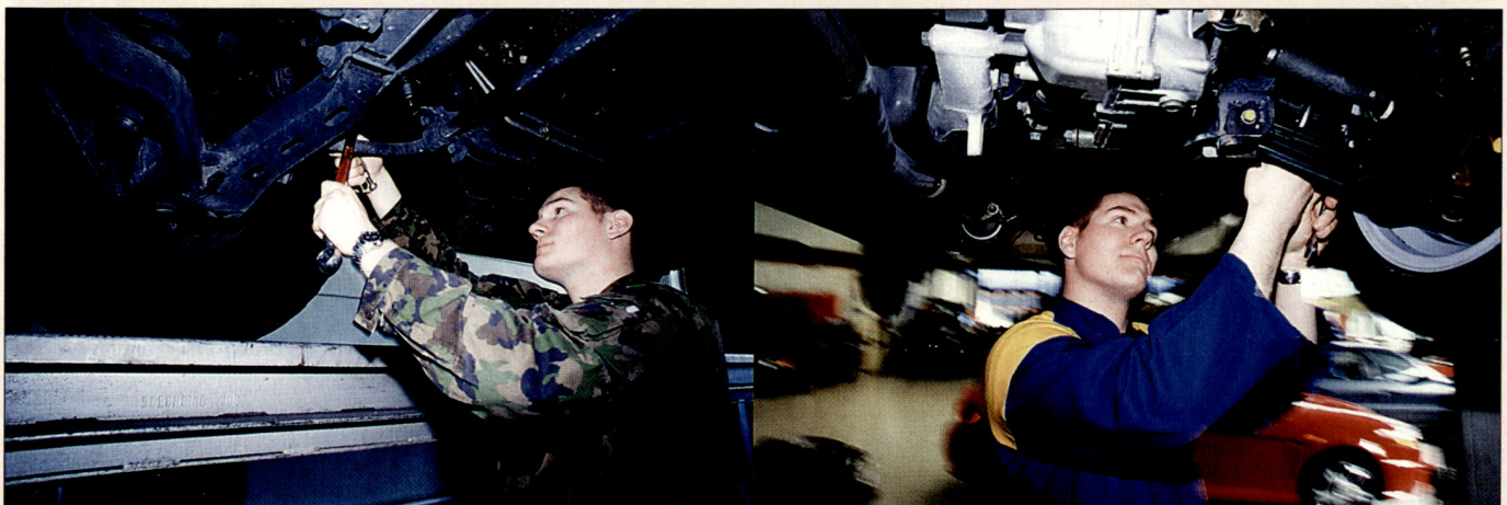
Fachliche Qualifikation, Praxiserfahrung und der Wegfall der WK-Pflicht zeichnen den Durchdiener auf dem Arbeitsmarkt aus.